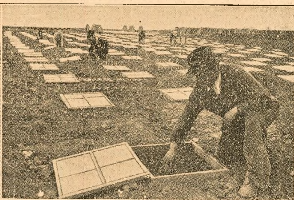
zarzavatur. Pentru a obține o recoltă bogată, colectiviiștii au făcut din timp peste 1500 mp. răsadnițe, unde se vor produce toate răsadurile necesare gospodăriei. În primul eișeu: brigada legumicolă din gospodăria colectivă din Mădăras, regiunea Oradea lucrează de zor la întărirea răsadurilor de varză, ardei și roșii. Eișeul al doilea: o cultură timpurie de castraveți sub cutii cu geamuri.

Conștienți fiind că aplicarea metodelor agrotehnice le va aduce o recoltă bogată, colectiviiștii au însămânțat la timpul potrivit cele 76 ha. porumb, 25 ha. ovăz, 15 ha. orz, 19 ha. mazăre, 30 ha. floarea soarelui, precum și secăci de zahăr, mazăre, cartofi, cănești și altele.