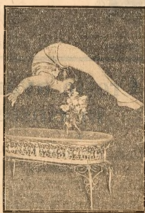
Grupul artistic al delegației tineretului din R. P. Mongolia a dat o serie de spectacole valoroase, cuprinzând, printre altele și excepționale numere acrobatiche. În clipse: o scenă de la un spectacol dat în plaja Tolbului.