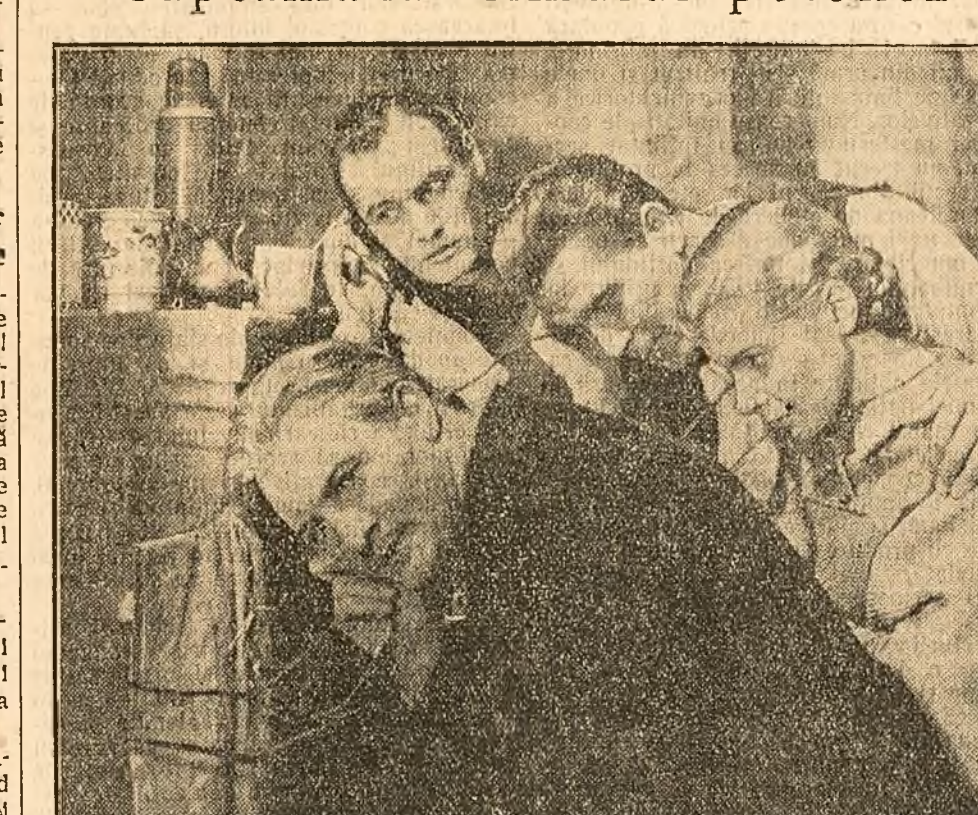
În clișeu: O scenă din filmul „Soldatul victoriei”

Filmul polonez, care a obținut remarcabile succese în ultimii ani și este prețuit de spectatorii noștri, constituie una din mărfurile artistice vii și convingătoare despre posibilitățile largi pe care le au țările democrat-populare de a-și dezvolta fiecare o industrie și artă cinematografică proprie, națională, pusă în slujba satisfacerii necesităților culturale ale masei, în slujba prieteniei între popoare.