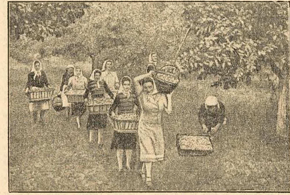
Culesul fructelor este și el o treabă de sezon. Fructele culese la timpul potrivit vor avea o calitate superioară și vor contribui la o mai bună aprovizionare a oamenilor muncii. În clișeu: La gospodăria agricolă colectivă „I. C. Frimu” din comuna Leordeni, regiunea Pitești, culesul prunelor este în toi.