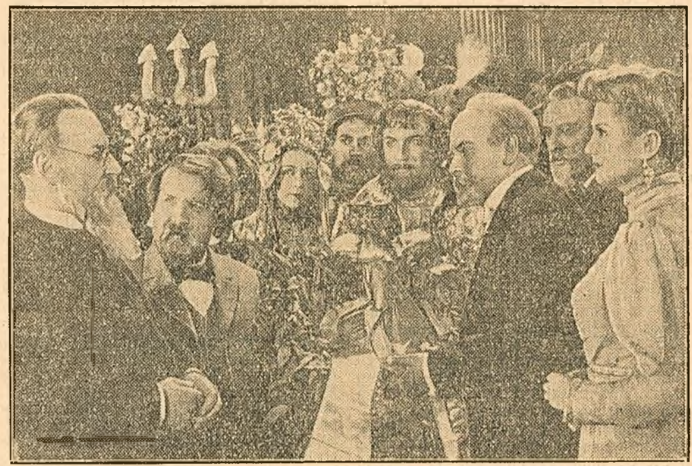
În cadrul „Festivalului filmului muzical”, care va avea loc între 1 și 7 Noiembrie la cinematograful „Patria”, va fi prezentat în premieră filmul artistic tehnicolor „Pe aripile cântului” (Rimschi-Corsacov), o nouă realizare a studioului „Lenfilm”. Creând o imagine vie a activității și vieții lui Rimschi-Corsacov, filmul prezintă în același timp selecțiuni din cele mai celebre opere ale marelui compozitor. Creat în regia lui G. Roșal și G. Cazanchi, filmul este interpretat de actorii sovietici de frunte. În rolul lui Rimschi-Corsacov apare G. Belov; vestitul critic de artă Stasov este interpretat de N. Cerascov, iar compozitorul Glazunov de V. Hohraevov.