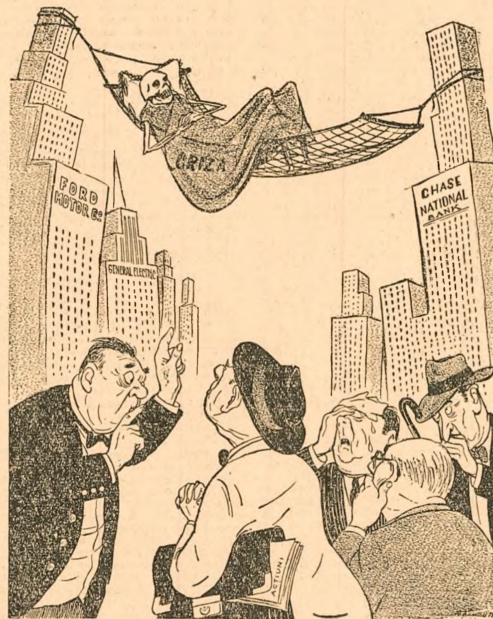
Pași! să nu pomenim de ea, poate că nu se trezește. Desen de A. LUCACI

Cercurile monopoliste din S. U. A. cer să nu se vorbească de „criză”, „depresivitate” etc. pentru a nu stîrni panica. (Ziarele)