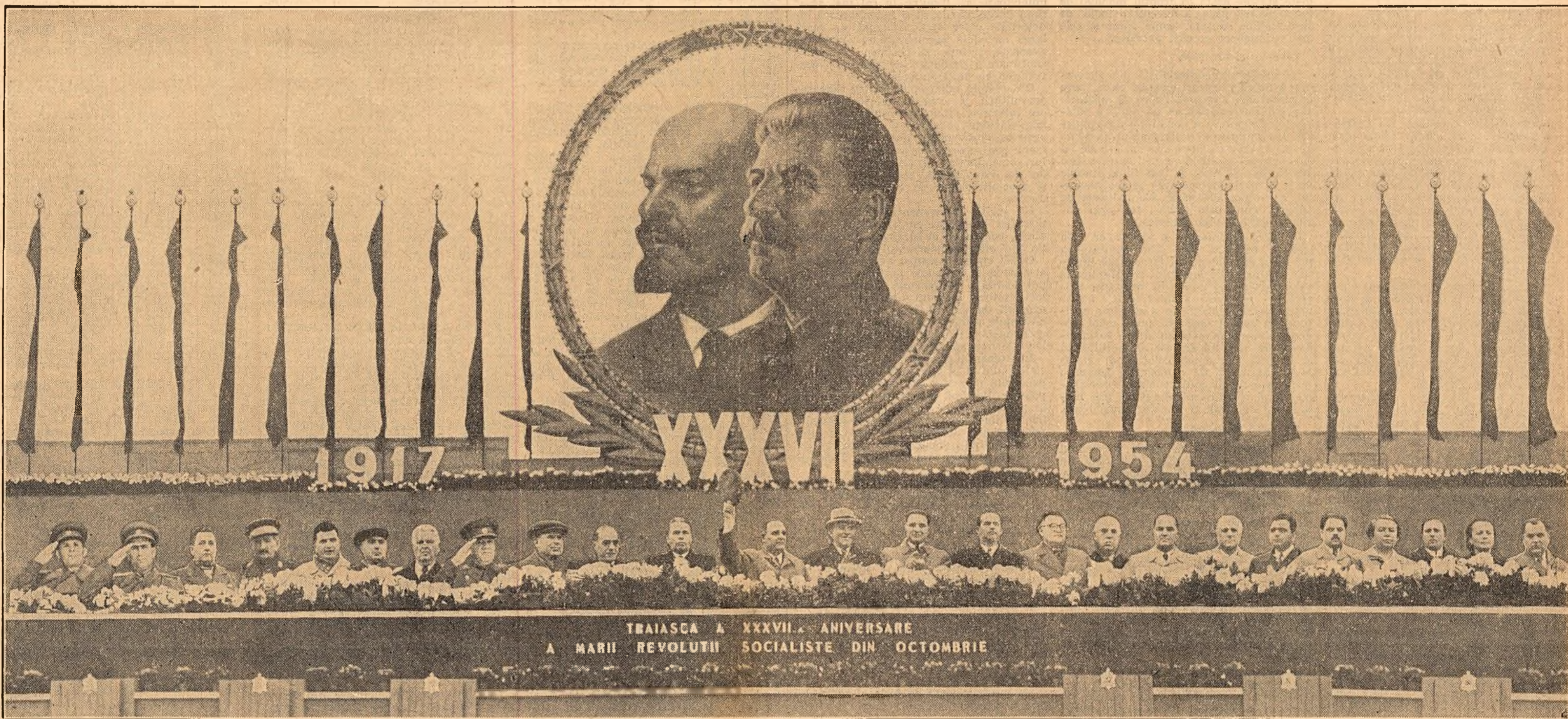
Un aspect al tribunei din piața „I. V. Stalin” în timpul mitingului oamenilor muncii din Capitală.

Recepții la ambasadele și misiunile sovietice cu prilejul zilei de 7 Noiembrie (pag. 4-a).