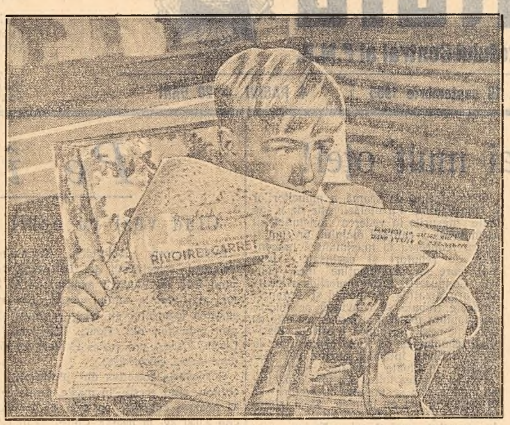
O scenă din film: Bernard, acuns îndărătul unei reviste ilustrate, își privește cercetătorii părinți. Revista e pe gusul lor: pe copertă, cu litere mari, e înscris un titlu de propagandă în favoarea războiului din Vietnam.

În cinematografia contemporană numele regiunii Wanda Jakubowska s-a impus datorită filmului „Ultima etapă”, creație remarcabilă a cinematografilor polone. Realizatoarea „Ultimei etape”, părăsind decorul sumbru al Auschwitz-ului, locul unde criminalii hitleristi ucisese milioane de oameni, a creat acum un film optimist, străbătut parcă de briza mării, încălzit de soarele primăverii.