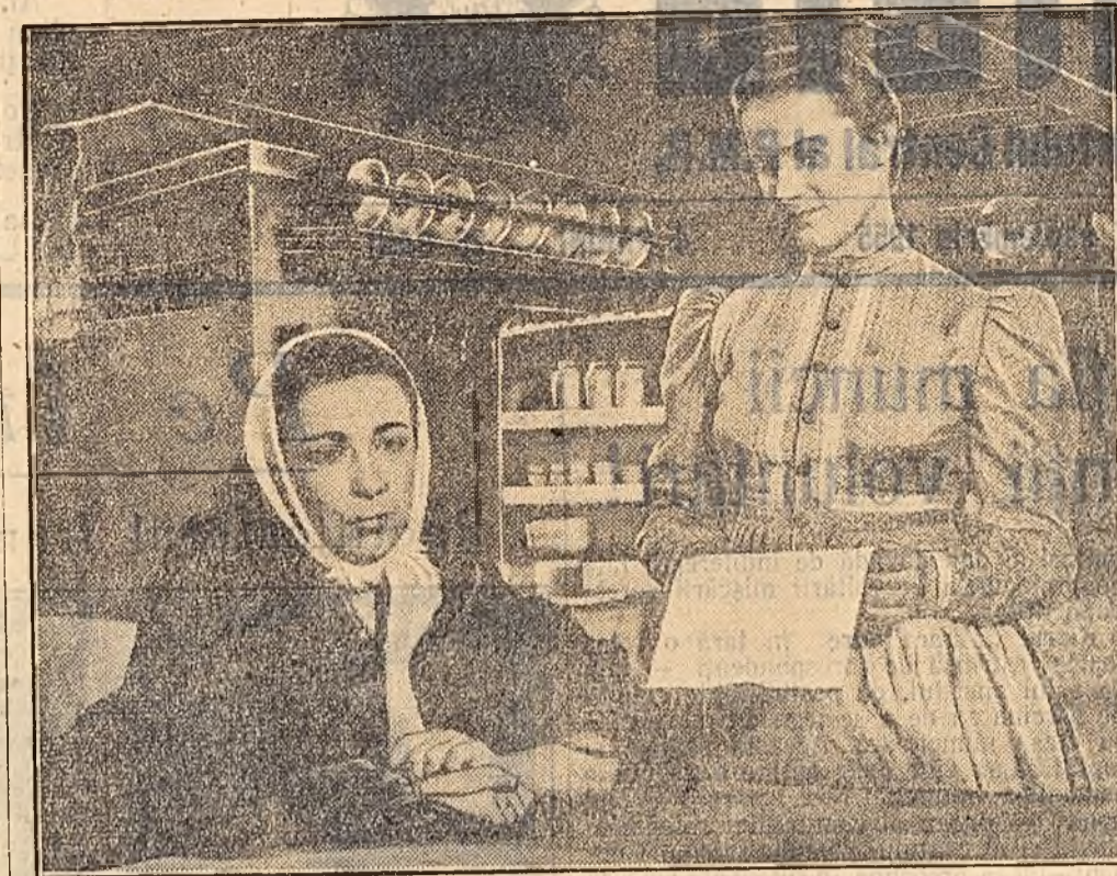
Pe ecranele cinematografulor noastre a început să ruleze o remarcabilă creație a studiourilor din R. Cehoslovacă — filmul în culori „Frona”. Inspirat din viața nouă a satului cehoslovac, filmul „Frona” a fost distins la festivalul cinematografic internațional de la Carlsbad-Vary cu „Premiul luptei pentru omul nou”.