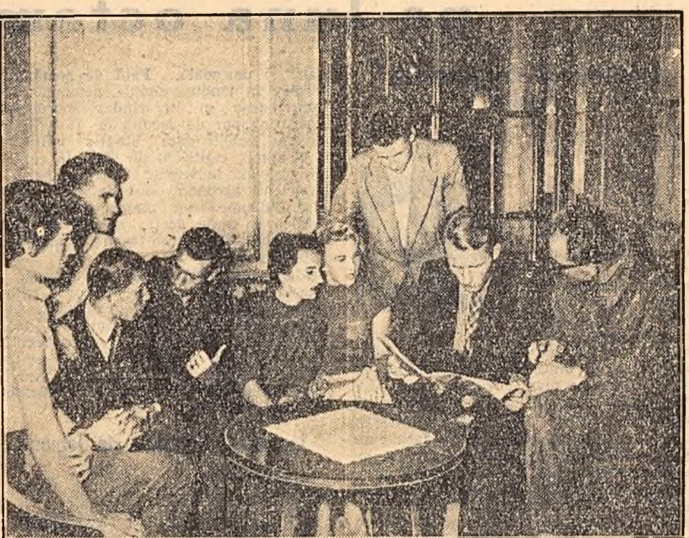
În Capitala țării noastre, avioanele și trenurile au adus circa 300 de atleți și atlete din 17 țări ale Europei, care participă, începînd de azi, la campionatele internaționale de atletism ale R.P.R. Printre aceștia se află numeroși recordmanți mondiali, olimpici, europeni sau ai țărilor respective.

Printre însoțitorii concurenților, atleții și atletele s-au antrenat pe stadioanele Capitalei, s-au plimbat împreună, au legat noi și trînărice prieteni.