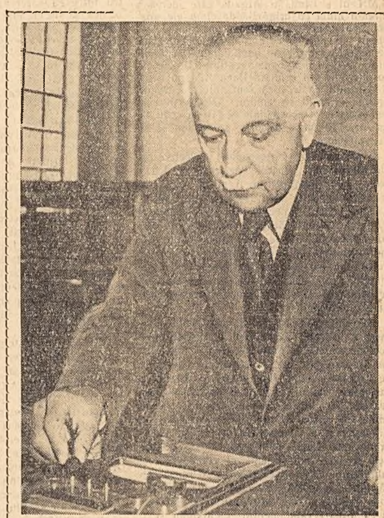
Întîmpinăm Congresul P.M.R. cu interes și entuziasm, pentru că noi, oamenii de știință, am simțit întotdeauna ajutorul partidului în munca de cercetare științifică. Cercetătorii de la Institutul de Energetică al Academiei R.P.R. închină acestui însemnat eveniment o serie de lucrări importante. Vor fi efectuate încercările experimentale asupra tipului de motor R.M.-13 produs de colectivul uzinelor „Mătyás Rákosi” din București, va fi terminat studiul termotehnic al unui captor de la fabrica de ciment „Ilie Pintilie”-Fieni, vor fi terminate cercetările asupra posibilității de reducere a procentului de sterilități conținut în lignitul din țara noastră.

În întrecerea în cinstea Congresului partidului, muncitorii de la această întreprindere s-au angajat să producă pînă la 23 decembrie, 1000 de tone de ciment peste plan anual.