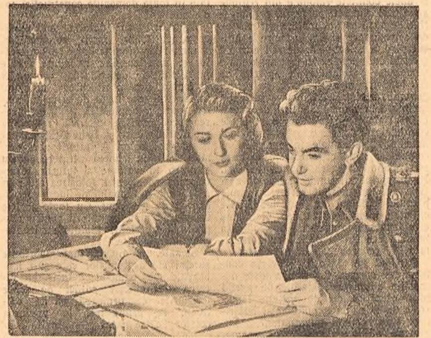
Realizat după un roman al scriitorului Karinthy Ferenc, filmul "Într-o primăvară la Budapesta" este o evocare a zborului care a precedat eliberarea Capitalei R. P. Ungare...