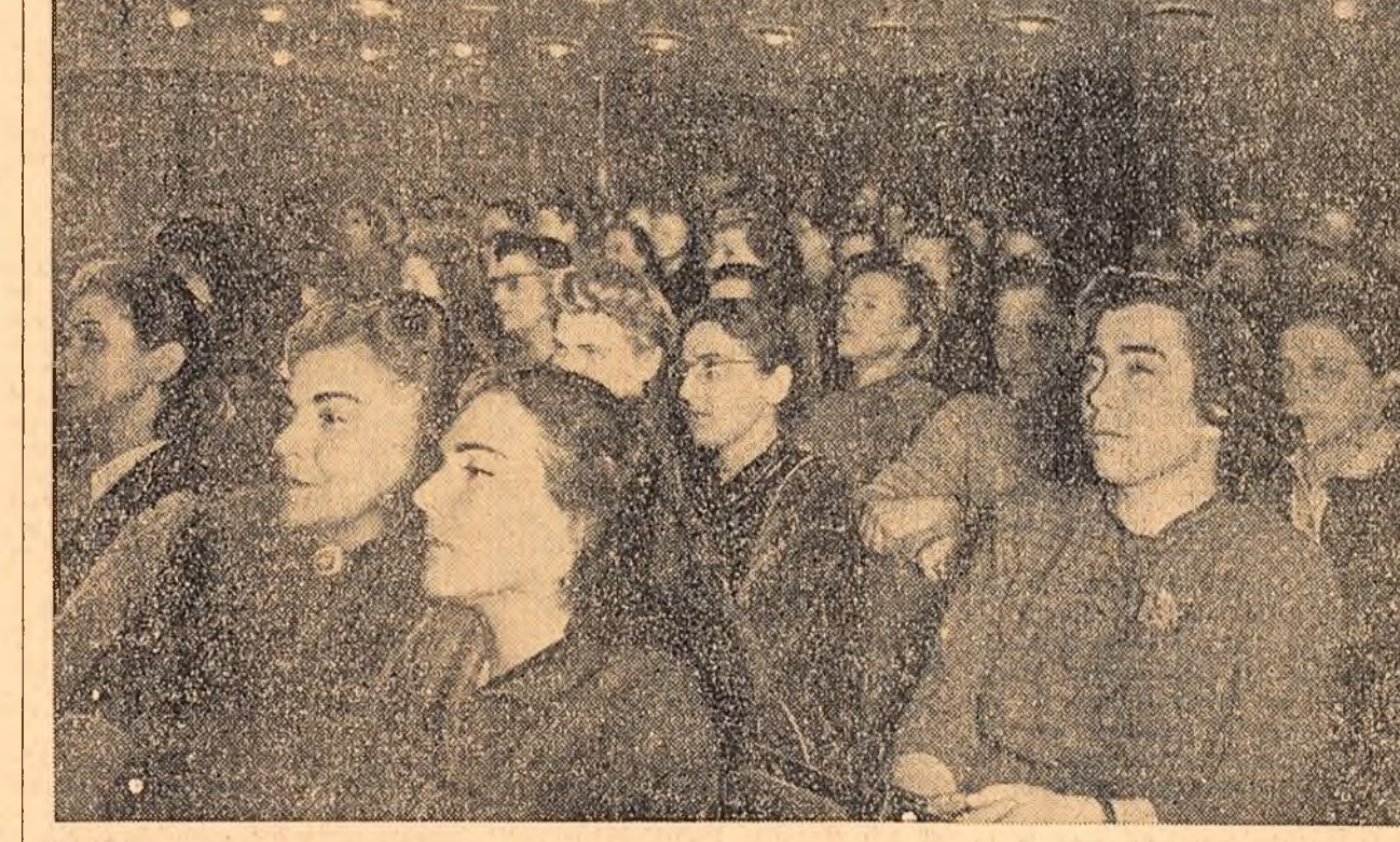
Aspect de la adunarea festivă care a avut loc ieri în sala teatrului Consiliului Central al Sindicatelor din Capitală cu prilejul sărbătoririi a 10 ani de la înființarea Federației Democratice Internaționale a Femeilor. (Citiți dărea de seamă în pag. 3-a).