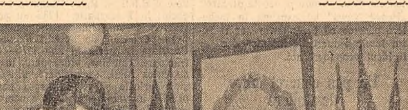
Ieri s-au deschis in Capitala centre de afisare a copiilor de pe listele de alegatori...