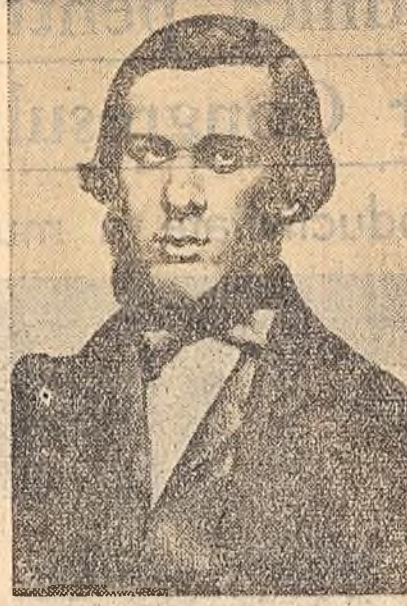
N. A. DOBROLIUBOV

Se împlinesc azi 120 de ani de la nașterea marelui revoluționar democrat rus N. A. Dobroliubov. Lucrările acestuia reprezentând de frunte al democrației revoluționare și al gândirii materialiste constituie, alături de opera învățatului și tovarășului său de luptă, Cernișevski, apărând gândirii filozofice social-politice și estetice premarxiste.