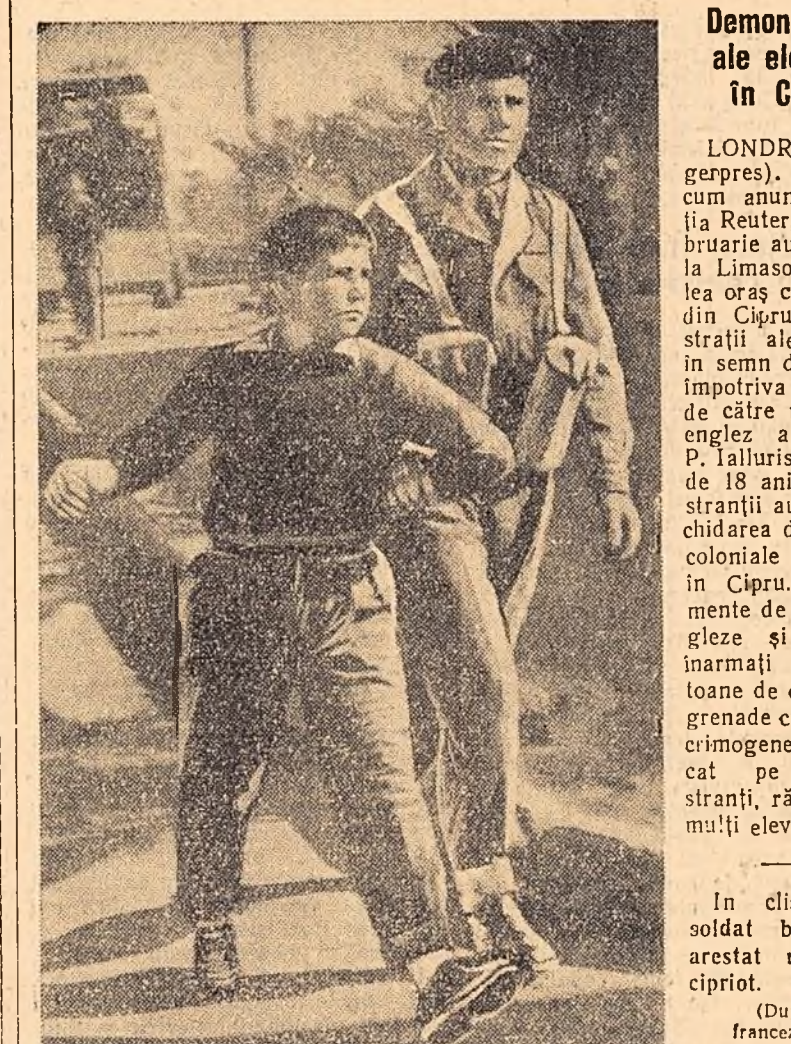
Un soldat britanic a arătat un școlar cipriot.