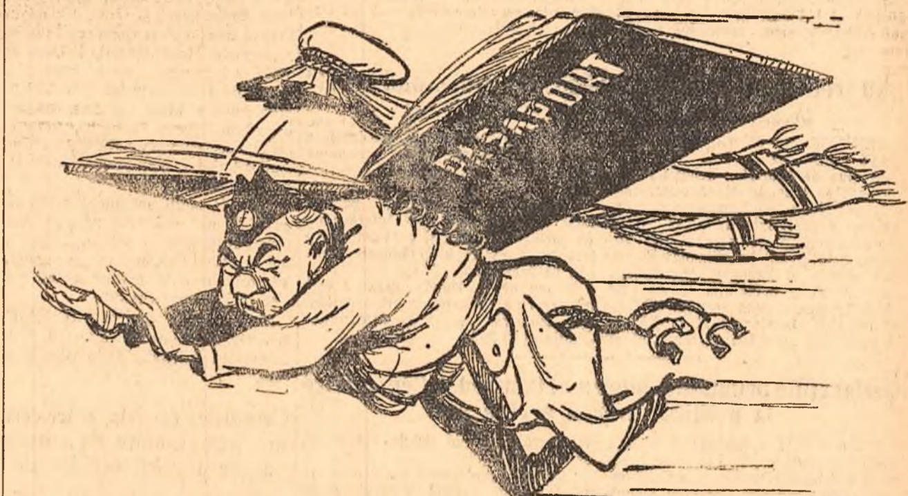
„I s-a făcut vînt și... a zburat!”