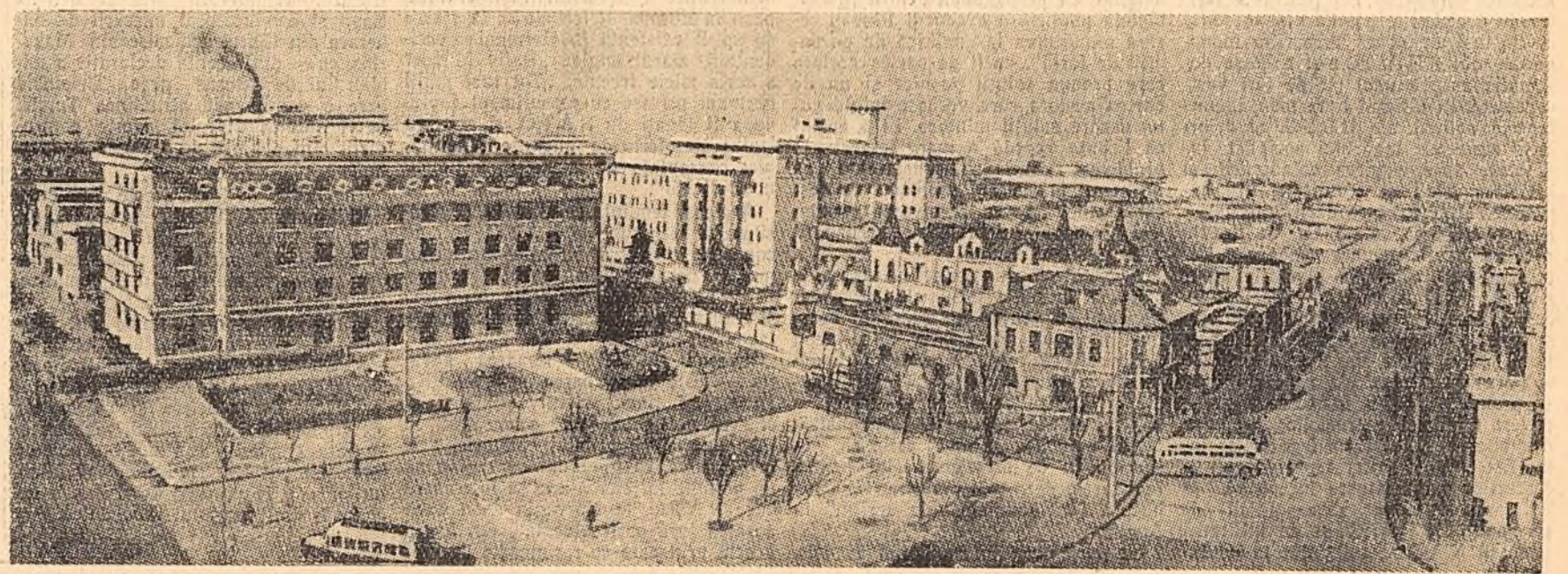
În împrejurimile Pekinului, precum și în centrul orașului, pretutîndeni privirile sînt atrase de noile clădiri pentru instituții, de noile uzine și fabrici, institute de învățămînt, corpuri de spitale, cămine pentru muncitori și funcționari. În clișeu: Hotelul Sînfiiao (la stînga) și spitalul Tunjen (în centru).