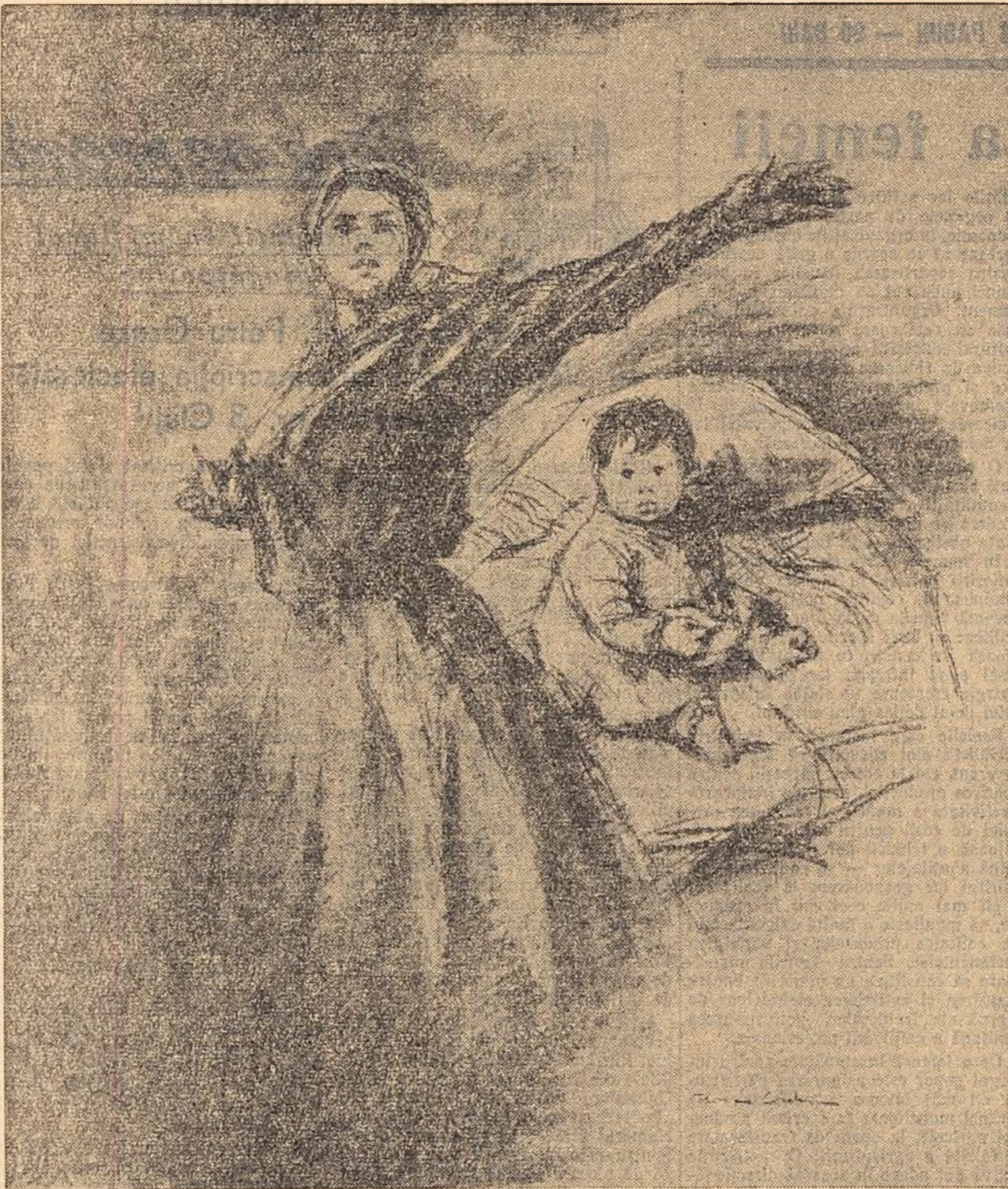
Desen de FLORICA CORDESCU

INGINER CONSTANȚA MARINAȘ I.P.R.O.M.E.T.