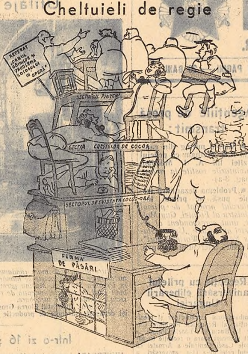
Bază și suprastructură desen de KUKRINKSI din ziarul „PRAVDA”