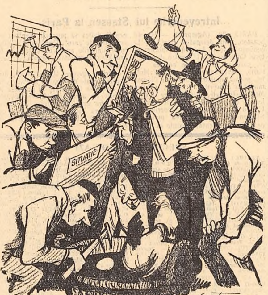
GAINA: Eu ridic producția, ei ridică prețul de cost. Desen de EUG. TARU

La unele gospodării agricole de stat personalul administrativ a crescut nemotivat față de nevoile producției.