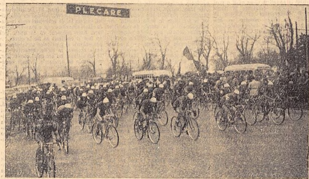
De la stîr, cicliștii pornesc întrecerea în cea de-a IX-a ediție a tradiționalei competiții ciclistice „Cursa Științei”. (Reportajul în pag. 3-a)