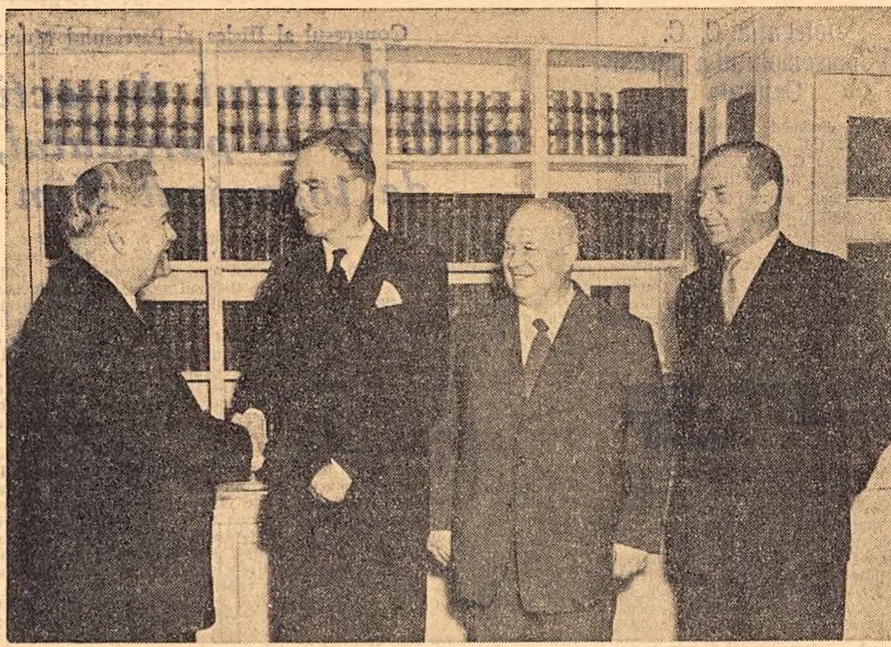
In clișeu: La reședința primului ministru al Marii Britanii din Downing Street 10. De la stînga la dreapta: N. A. Bulganin, Anthony Eden, N. S. Hrușciov, Selwyn Lloyd, ministrul Afacerilor Externe al Marii Britanii.

● Oaspeții sovietici au participat la un dejun oferit în cinstea lor de președintele Camerei Comunelor, după care ei au urmărit dezbaterile Camerei. Apoi ei s-au îndreptat spre Camera lorzilor.