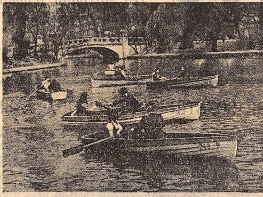
Florile de primăvară smălţează din nou parcul Cişmigiu. Pe luci lacului au început plimbările cu barca.