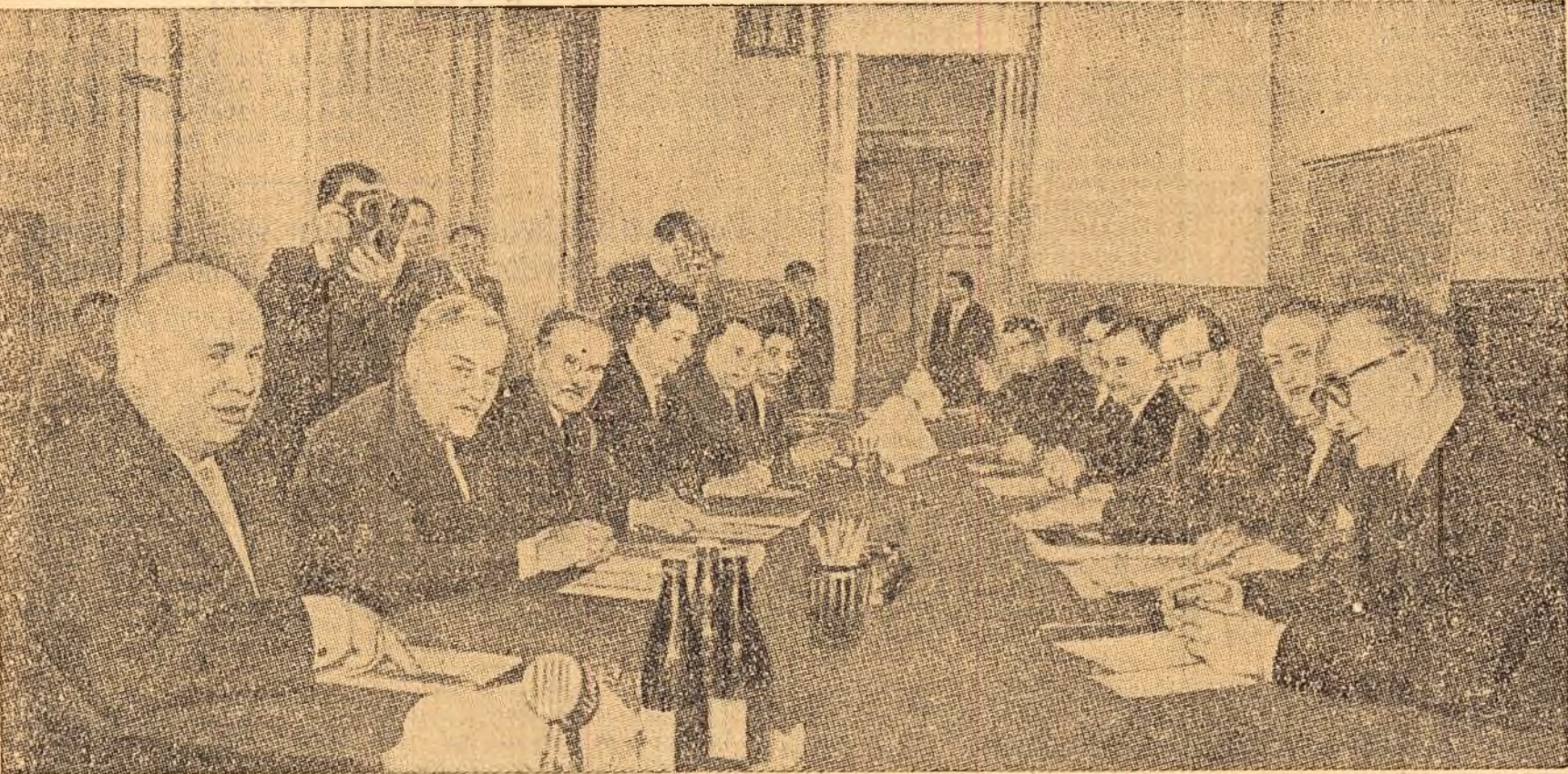
La 16 mai au început tratativele între delegația guvernamentală a U.R.S.S. și delegația guvernamentală a Franței. În cișeu: În sala de ședințe.