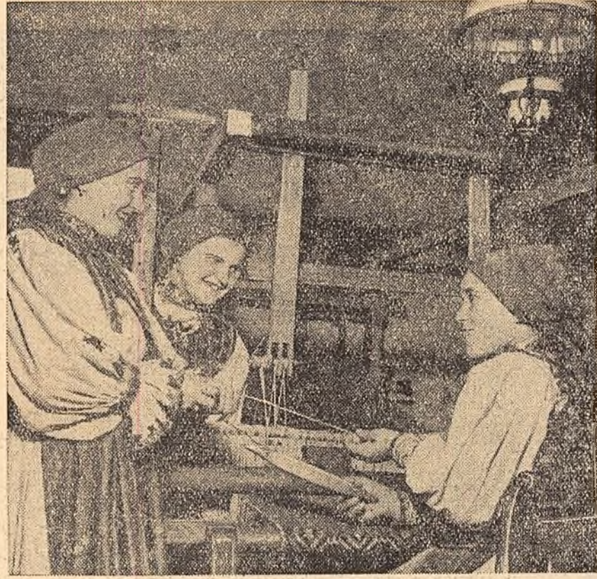
Harnice sînt fetele din Oas! Mîinile lor inderminătoare țes minunate lucruri de artă populară, telurice cusături naționale...