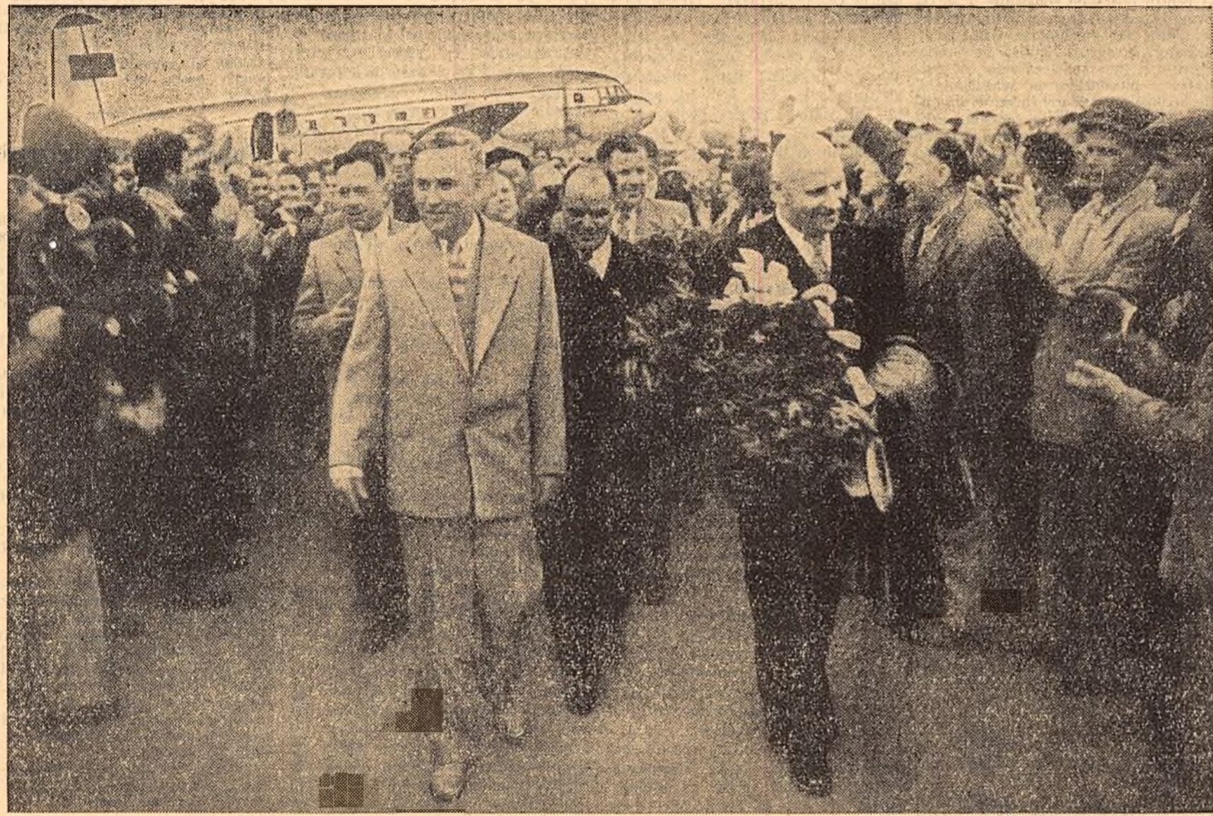
Membrii delegației Sovietului Suprem al U.R.S.S. la sosirea pe aeroport

Primirea delegației Sovietului Suprem al U.R.S.S. de către cetățenii Capitalei pe aeroportul Băneasa