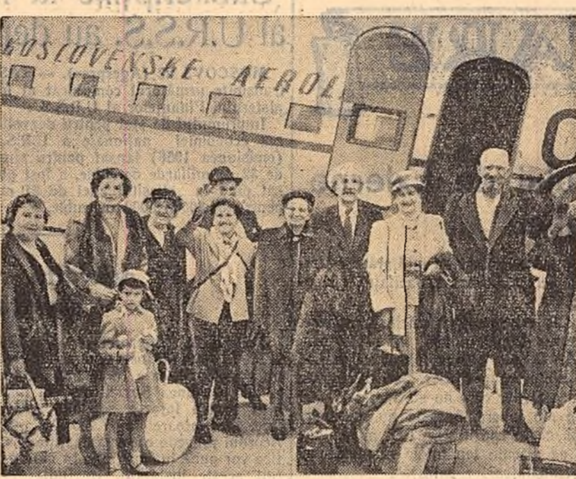
Ieri a sosit în Capitală un grup de 19 turiști din S.U.A. Cu prilejul călătoriei pe care o face în țara noastră...