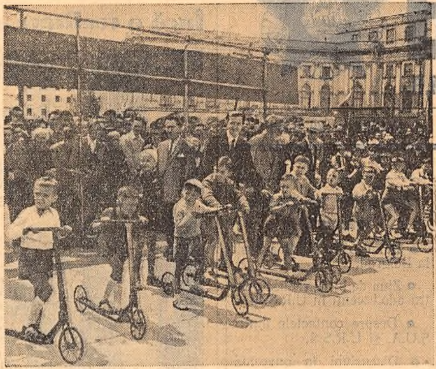
În cinstea zilei internaționale a copilului, duminică dimineața a avut loc în Piața Republicii un concurs de trotinete și triciclete pentru copii.

În cișeu: Un grup de „concurenți” sînt gata de plecare în cursa cu trotinetele.