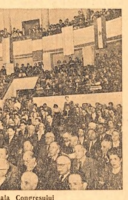
Un aspect din sala Congresului