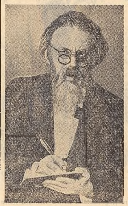
V. O. TOPORKOV, Artist al poporului din U.R.S.S. în rolul profesorului din piesa „Rodele învătături”