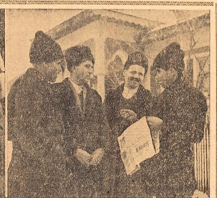
Muncitoare de la Filatura Romînească de Bumbac din Capitală (stînga) și un grup de țărani muncitori din comuna Ghimpați, raionul Răcari (dreapta), discutînd cu însuflețire documentele plenarei C.C. al P.M.R.