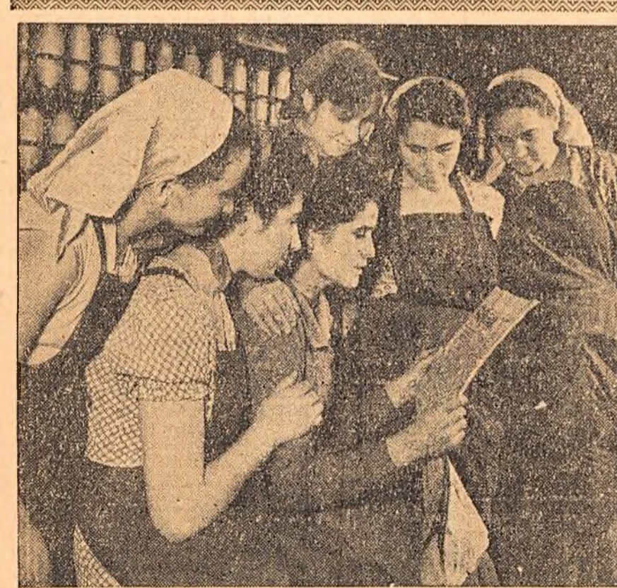
Muncitoare de la Filatura Romînească de Bumbac din Capitală (stînga) și un grup de țărani muncitori din comuna Ghimpați, raionul Răcari (dreapta), discutînd cu însuflețire documentele plenarei C.C. al P.M.R.