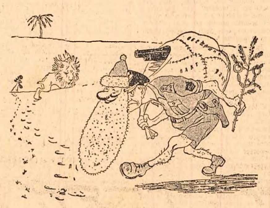
Moș Gerilă american a pornit la ofensivă asupra Orientului. El aduce în tolbă pacte și promisiuni...

rilor colonialiste, asasinat de insurgenți. În ziua funeraliilor au fost ucîși 6 algerieni, și răniți alți 100. „Uniunea generală a oamenilor muncii algerieni” (organizație sindicală care sprijină Frontul Național de eliberare din Algeria) a cerut muncitorilor să facă o grevă de 24 de ore în semn de protest împotriva violențelor colonialiștilor. Răspunzînd acestui apel din seara de 2 ianuarie au încetat lucrările funcționarilor de la poșta din Alger. Începînd din dimineața zilei de 3 ianuarie transportul din orașul Alger a fost paralizat. Au declarat grevă docherii și muncitorii de la mai multe întreprinderi industriale.