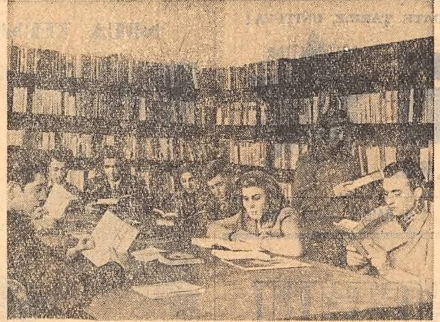
La Zemeș, în mijlocul pădurilor de brazil și sonde, s-a ridicat o nouă și frumoasă construcție: Clubul muncitoresc-Zemeș. În clișeu: Sala de lectură a clubului.