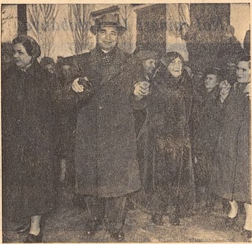
În ora care s-a pornit secția de votare nr. 24, din raionul Grivița Roșie a intrat și tovarășul Gheorghe Apostol