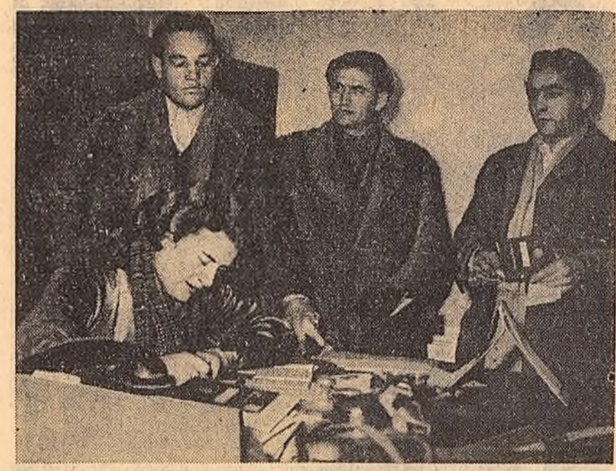
În luna ianuarie minierii unguri au îndeplinit planul la extracția de cărbune în proporție de 108,1 la sută. Din diferite părți ale Ungariei numeroși muncitori s-au prezentat la muncă în mine. În clipă: La unul din birourile de angajare ale minelor din Tatabánya