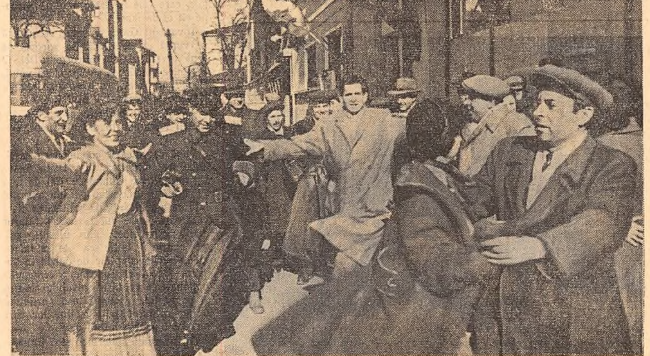
Voia bună, veselia n-au lipsit. Alegătorii de la secția de vot nr. 5 din circumscripția electorală „Ana Ipătescu” au încins o horă îndrăcită