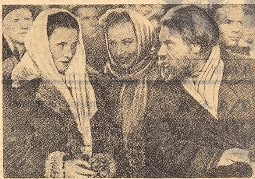
Scenă din filmul sovietic în culori „Mai presus de dragoste” (producție „Lenfilm”), care rulează în prezent pe ecranele cinematografulor noastre