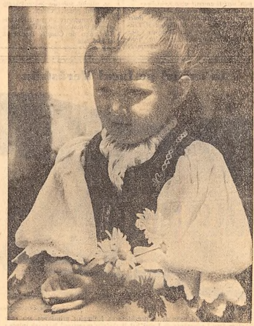
Fetița din țara moșilor (Din concursul de fotografii organizat de Direcția de turism și excursii a C.C.S.).

Potrivit indicațiilor Plenarei din decembrie 1956 a C.C. al P.M.R., în legătură cu lărgirea atribuțiilor sfațiilor populare, Consiliul de Miniștri al R.P. Române a aprobat o hotărîre privind trecerea unor unități de artă și de cultură, a unor întreprinderi cinematografice și poligrafice din subordonarea Ministerului în subordonarea sfațiilor populare. Hotărîrea stabilește, între altele, că Teatrul „Constantin Nothara“, Teatrul de stat de operă, Teatrul Tineretului, Teatrul satiric muzical „C. Tănase“ și Ciroul de stat din București trec la Sfatul popular al Capitalei.