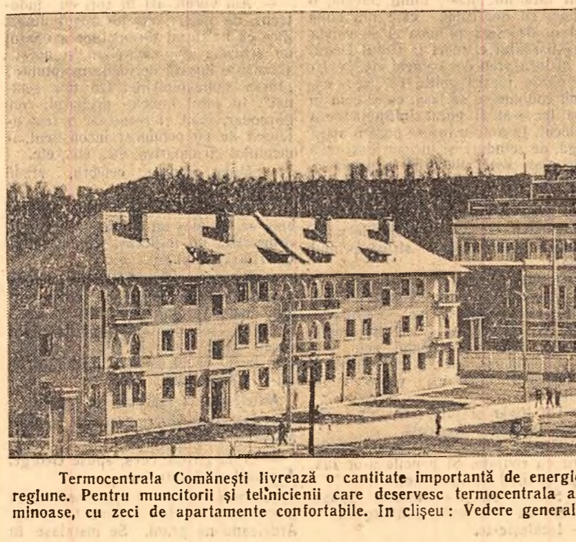
Termocentrala Comănești livrează o cantitate importantă de energie electrică întreprinderilor și satelor din regiune. Pentru muncitorii și tehnicienii care deservesc termocentrala au fost construite blocuri frumoase și luminoase, cu zeci de apartamente confortabile. În clădire: Vedere generală a termocentralei Comănești.