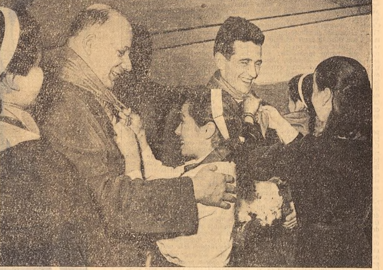
Moment emoționant la sosirea solilor Partidului Comunist Francez pe aeroportul din Bacău