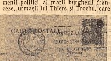
Facsimilul cărții poștale trimise de un grup de intelectuali din Strasbourg, pe adresa Legăției României la Paris, prin care cer eliberarea imediată a tuturor condamnaților în procesul conducătorilor luptelor ceteriste din 1933.

Perioada 1940—1944 a fost cea mai grea din istoria poporului francez. Oamenii politici ai marii burghezii franceze, urmașii lui Thiers și Trochu, care