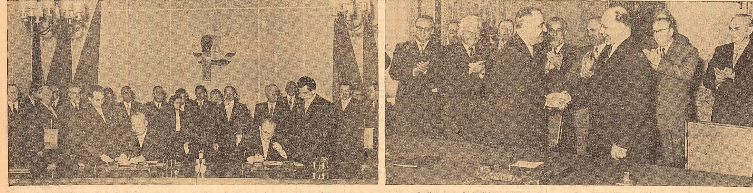
Semnarea Declarației comune a guvernului R. P. Romine și a guvernului R. D. Germane

HANOVA. La 28 aprilie s-a desluit la Hanovra (R. F. Germană), tradiționalul Tîrg Industrial pe anul 1957 în care, alături de întreprinderile post-germane, sînt reprezentate și numeroase firme străine. La tîrg au sosit delegații din țări capitaliste și dintr-o serie de țări ale lagărului socialist, printre care Uniunea Sovietică și R. P. Chineză.