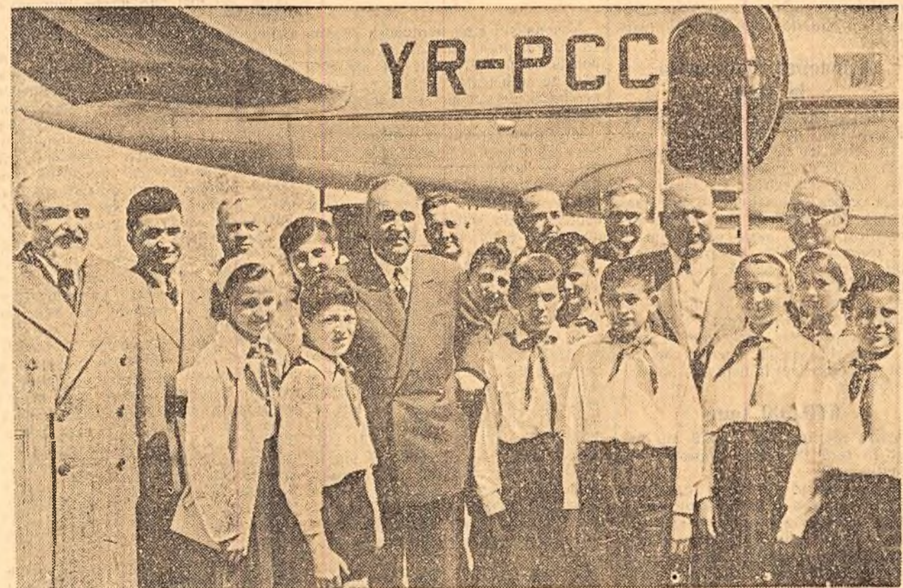
Pe aeroportul Băneasa, la înalțarea din R. D. Germană a delegației guvernamentale și de partid a R. P. Romine