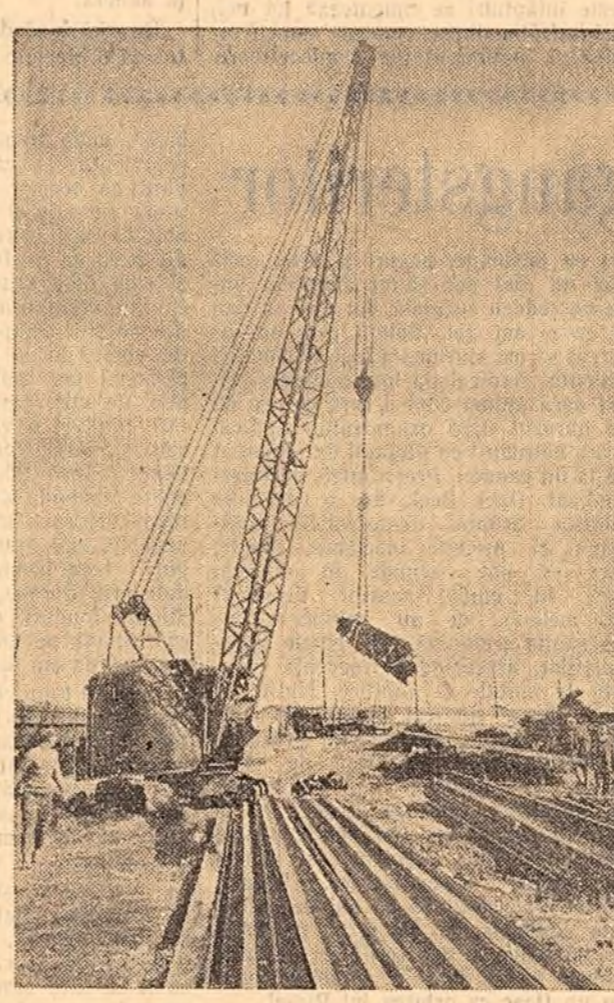
În gara Socola Roșie — cea mai mare gară de tranzit a țării noastre — sosesc zilnic trenuri încărcate cu diferite mărfuri din U.R.S.S.

De 1 Mai 1957, poporul român își va manifesta cu putere hotărîrea de a apăra cauza păcii și colaborării internaționale, solidaritatea cu toate popoarele care luptă pentru pace și independența națională. Sprînjind orice inițiativă menită să contribuie la deslindirea încordărilor internaționale, poporul nostru — constînt de forța sa în cadrul marelui lagăr al socialismului și ferm în fața oricărei încercări de amestec în treburile sale interne, Plîn vigilență și luptă unită a popoarelor lumii există toate posibilitățile de a pune friu agresorilor imperialiști, de a realiza noi progrese în dezvoltarea colaborării internaționale.