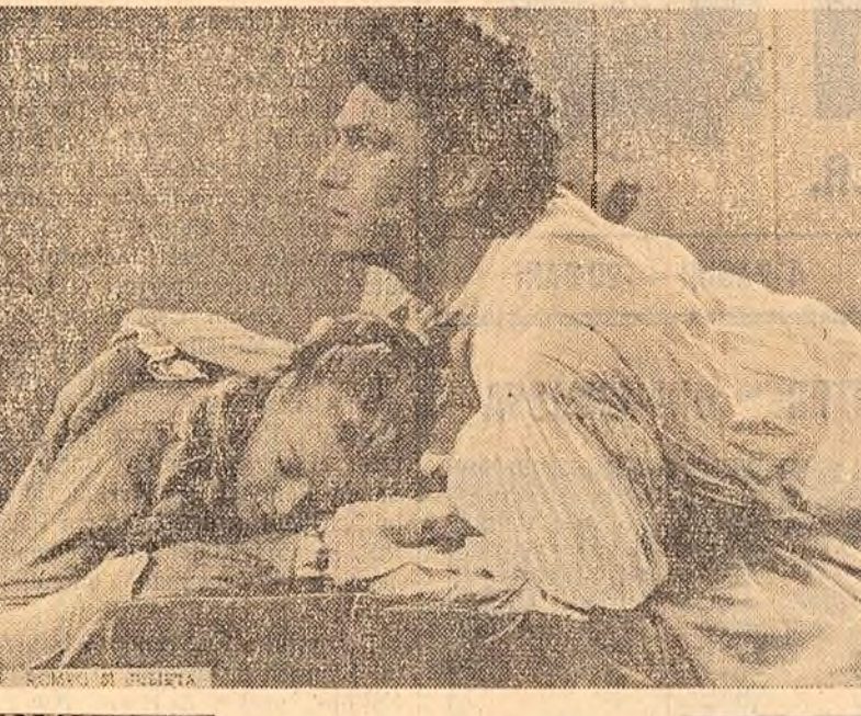
La cinematografele Republica, București și Gh. Doja din Capitală rulează filmul „Romeo și Julieta”, o producție a studiourilor engleze. Ecranizarea a fost făcută după tragedia lui W. Shakespeare. În clișeu: O scenă din film.