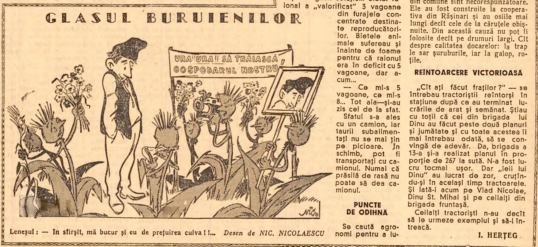
Leneșul: — În sfîrșit, mă bucur și eu de prețuirea culivă!... Desen de NIC. NICOLAESCU