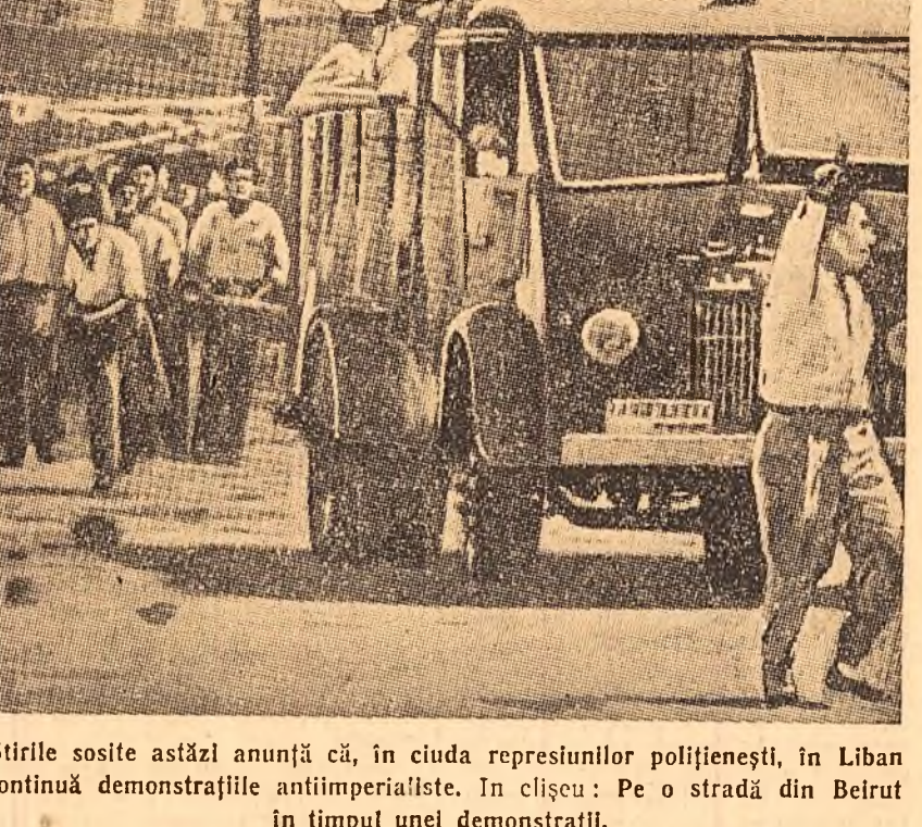
Știrile sosită astăzi anunță că, în ciuda represiviilor polițienești, în Liban continuă demonstrațiile antiimperialiste. În clișeu: Pe o stradă din Beirut în timpul unei demonstrații.