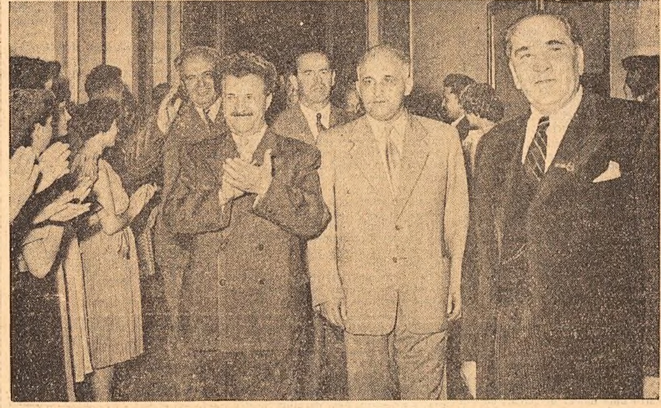
Vizita la Universitatea „Victor Babeș” din Cluj

noastră, avînd astfel prilejul să vă transmîtă dv. și prin dv. poporul frate și prieten bulgar cele mai sincere salutări. În mod deosebit vă rugăm să transmîteți din partea metalurgistilor din Copșa Mică un salut tovarășesc și succese în muncă metalurgistilor din orașul bulgar Kardjali!” A răspuns tov. Todor Jivkov care a spus printre altele: „Permiteți-mi, iubii tovarășii din raionul Mediaș, să vă transmît în numele delegației guvernamentale și de partid a R.P. Bulgaria, în numele membrilor muncii bulgari, al întregului nostru popor cele mai călduroase mulțumiri pentru primirea frumoasă pe care ne-ați făcut-o. Entuziasmul cu care sîntem primiți peste tot în cu-prinsul număratei dv. țări ne arată odată mai mult prietenia frățască, de nezdruccinat ce leagă popoarele noastre vecine!” Un grup de colectiviști din localitate a dăruit oaspeților bulgari un butoiș de lemn lucrat artistic, conținînd renumitul vin rominesc de Tirnăve. În orașul Sibiu, cu mult înainte de venirea oaspeților, o mare mulțime de locuitori se adunase în piața din spațiile gării, pe străzile ce duceau spre gară, așteptînd să salute pe oaspeți. La coborîrea din trenul oficial, oaspeții și persoanele care îi însoțesc au fost întâmpinați de tov. Maxim Bergheanu, prim-secretar al Comitetului regional Stalin al P.M.R., Nicolae Iorga, președintele Sfatului popular regional Sibiu, Gheorghe Făgărășanu, prim-secretar al Comitetului orașenesc Sibiu al P.M.R., Iosif Șerban, președintele Sfatului popular al