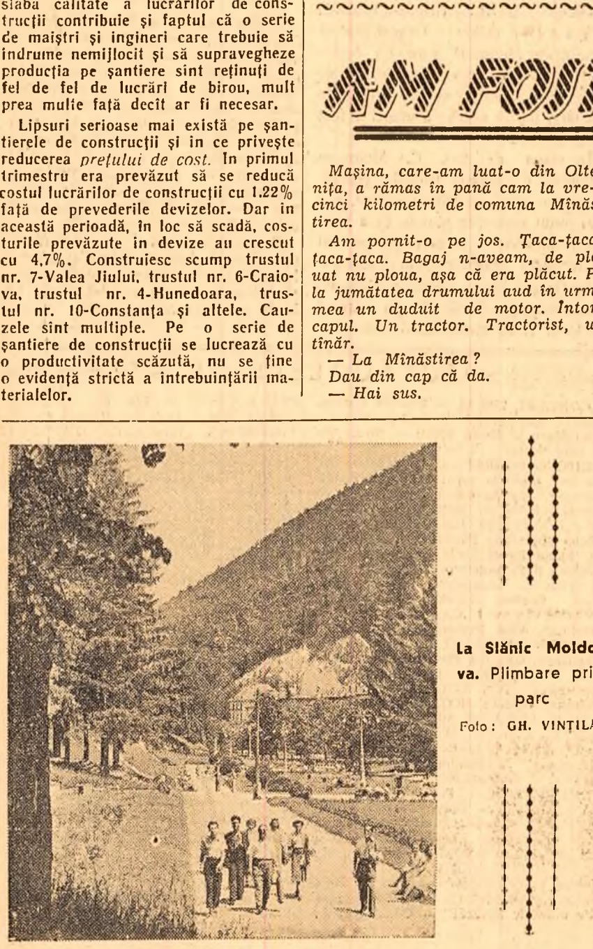
La Sîlnic Moldova. Plimbare prin parc

Într-o ședință prezidată de regele Hussein, Consiliul de Miniștri al Iordaniei a hotărît prelungirea cu încă trei luni a suspendării Parlamentului. So-para că de cînd se folosește de dolarii americani, regele Hussein nu mai are nevoie nici de un parlament: din S.U.A. pot fi importate, la nevoie, și legi.