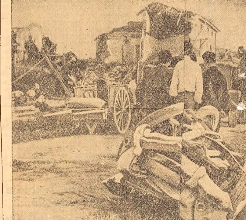
Puternica furtună care a bîntuit în Italia a pcat, după cum se vede în clișeu de mai sus, mari distrugerii materiale.