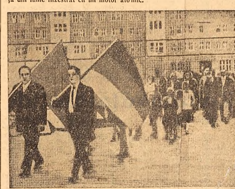
La recente alegeri din R. D. Germană, populația participă cu mult entuziasm. În clișeu: toți locatarii unui bloc de pe cea Stalin din Berlin se îndreaptă în grup cîntînd și cu steaguri spre local de vot.