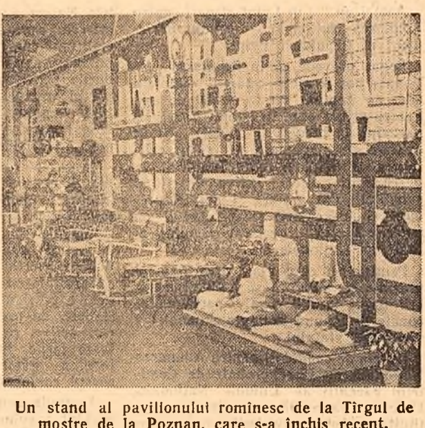
Un stand al pavilionului românesc de la Tirgul de mostre de la Poznan, care s-a inchis recent.