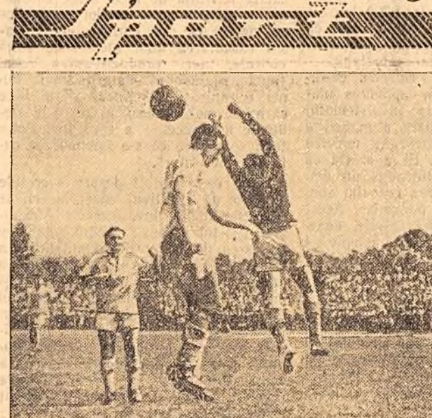
În cadrul „Cupei Primăverii” (categoria B) finala dintre Progresul Sibiu și Locomotiva Gara de Nord a fost câștigată de prima cu scorul de 3-2 (1-0)