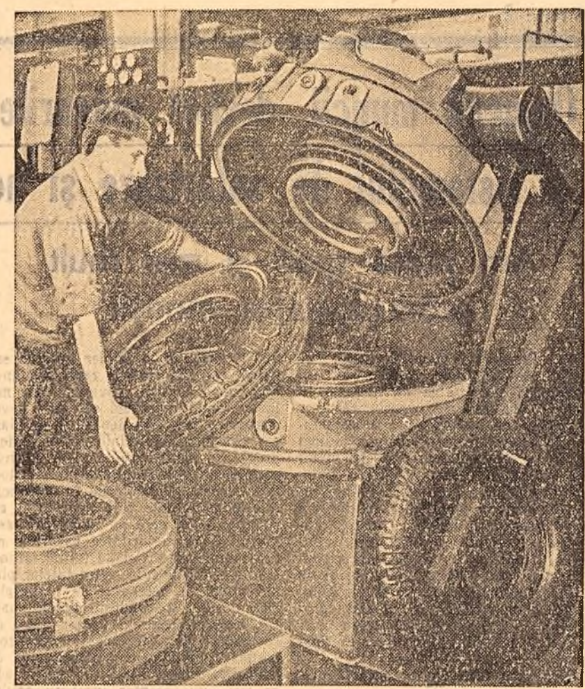
Sosetele patriei sînt străbătute de mil de autocamioane echipate cu caucioruri produse la întreprinderile „Victoria” din regiunea Ploiești.

În cursul vizitei pe care a întreprins-o în țara noastră, A. K. Kripalani a avut întrevederi cu acad. Mihail Ralea, președintele I.R.C.S.S., I.