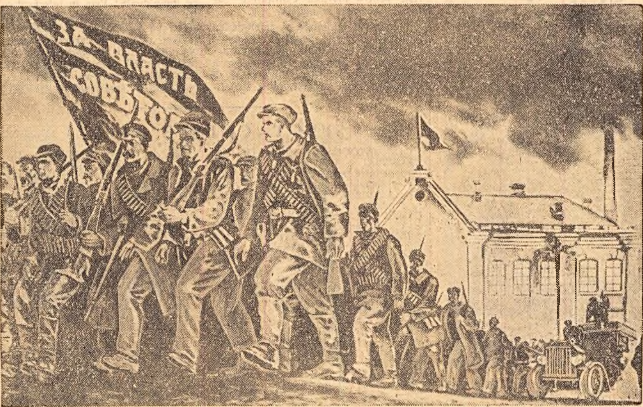
Pentru puterea sovietelor — scria în 1917 pe steagurile gărzilor roșii muncitorești.

Un marior ocular povestește că unul dintre conducătorii menșevici, aflat la tribună, s-a întors enervat și a spus