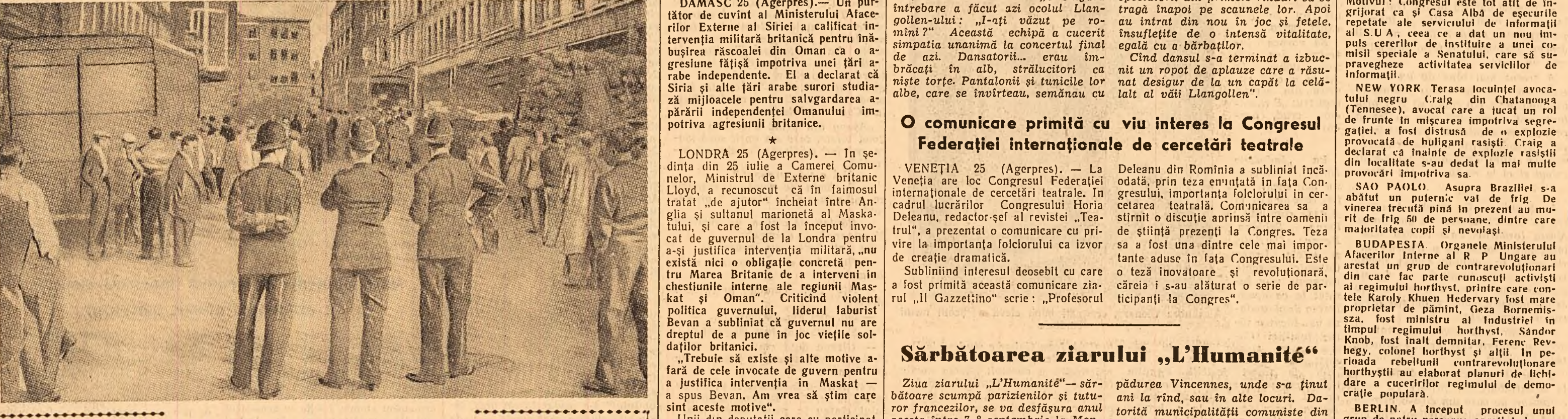
Clieșul de mai sus, reproduc din ziarul „Times”, înfățișează un aspect al grevei hamurilor din piața de legume și fructe Covent Garden...

LONDRA 25 (Agerpres).—Ansamblul de dansuri populare rominești care a participat la Festivalul Internațional de Dansuri și Cîntece Populare de la Llangollen (Anglia) a stîrnit entuziasmul presei engleze.