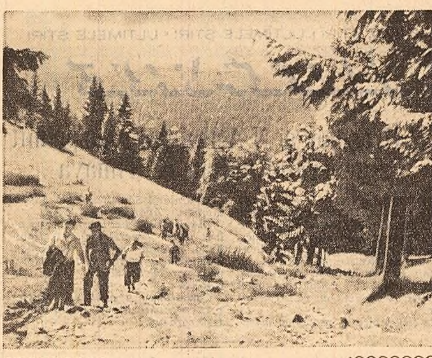
Grupuri de oameni ai muncii veniți la odihnă în pitoreasca stațiune climaterică Snaia se îndreaptă spre cota 1400.

În continuare, delegația a vizitat un atelier de mecanici și un atelier de mecanici și un atelier de mecanici.