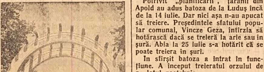
ROMAN. Plimbare prin parc.

În comuna Apold de Sus, din raionul Sebeș, sînt două batoze. Nicănu însă nu este folosită la treieratul recoltelor țărănilor din comună, deoarece birocrății de la sfatul popular raional au „planificat” ca aceste batoze să treiere în comuna Păuca și Prisca. Cu ce să treiere Apoldul? Cu o batoză tocmai din comuna Luduș, aflată la o distanță de cca 15 km.