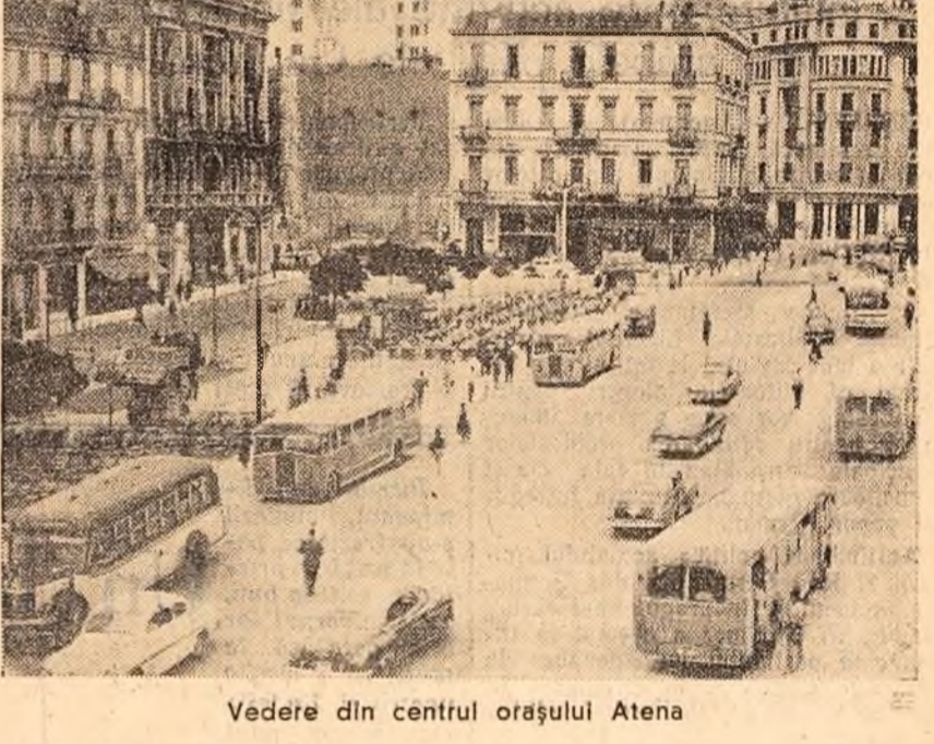
Vevedere din centrul orașului Atena

Astăzi, fotbaliiștii noștri joacă la Iașoroslavl cu echipa R. D. Germane.