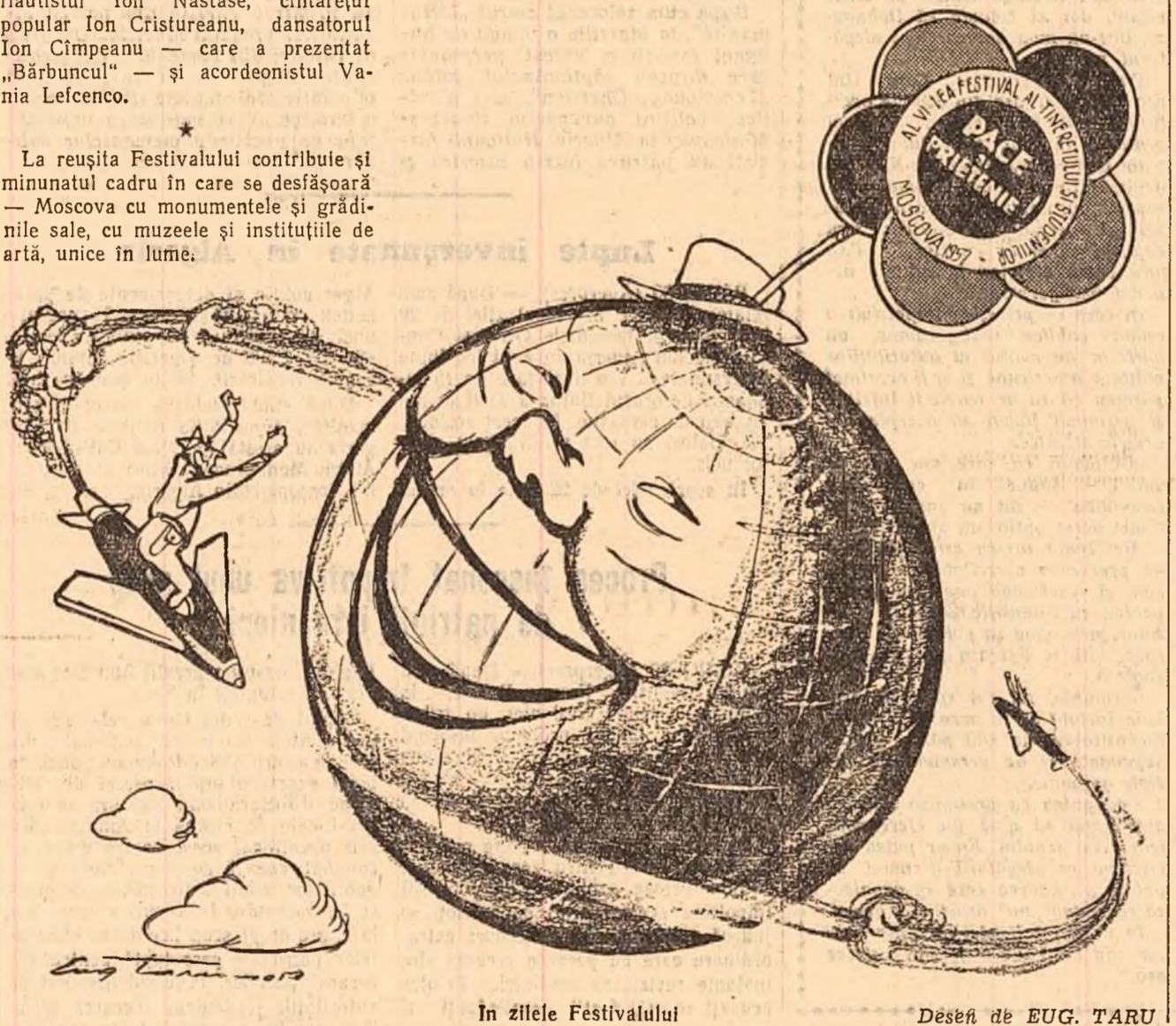
În zilele Festivalului. Desene de EUG. TARU