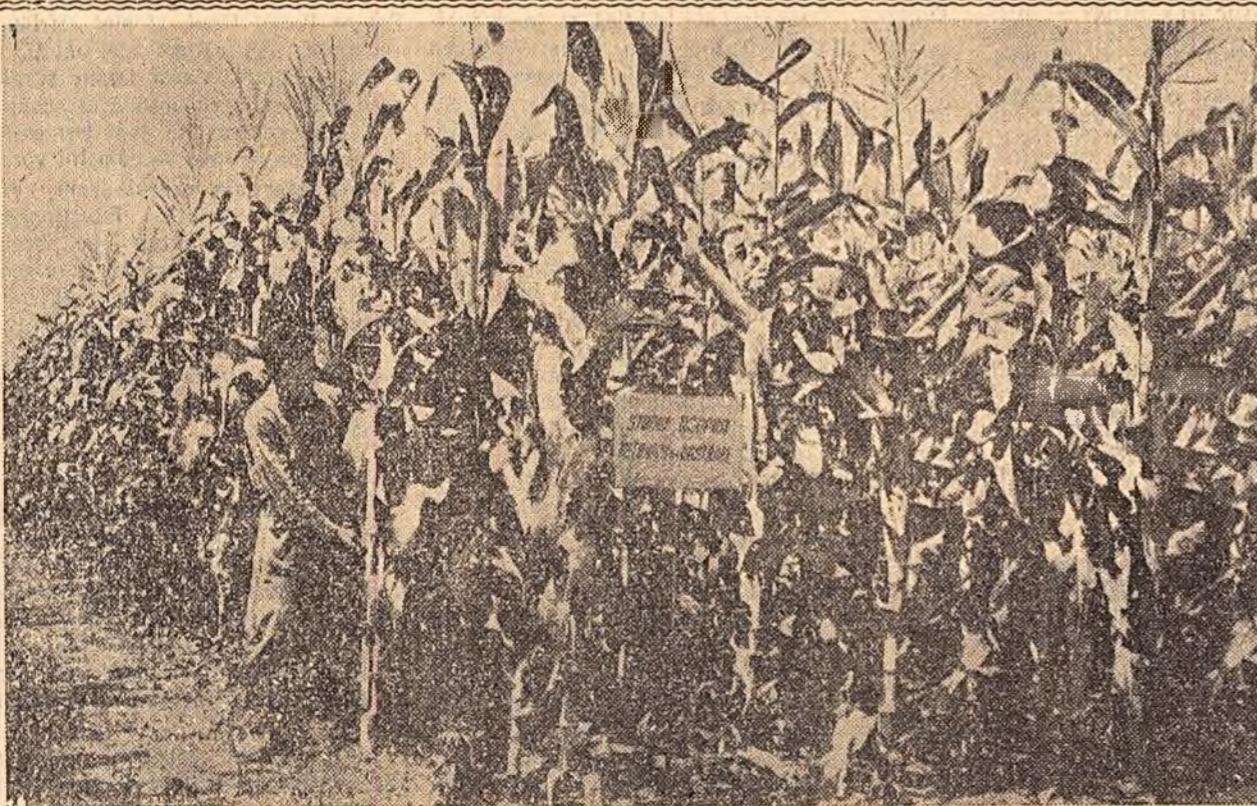
Cu toate că și-a început activitatea abia în primăvara acestui an, Institutul de cercetări pentru cultura porumbului de la Fundulea-București a obținut realizări însemnate. În clișeu: Se efectuează diferite măsurători la porumbul de pe parcela destinată experimentării diferitelor metode de castrare la porumb. (Citiiți în pagina a II-a reportajul „ÎN ÎMPĂRĂȚIA PORUMBULUI”).