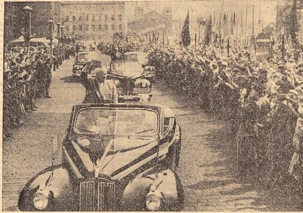
Zeci de mii de berlinezi înșirați pe străzi aclamă oaspeții sovietici.

MOSCOVA 7 (Agerpres). — TASS În dimineața zilei de 7 august a părăsit Moscova, plecând la Berlin, delegația de partid și guvernamentală a U.R.S.S.