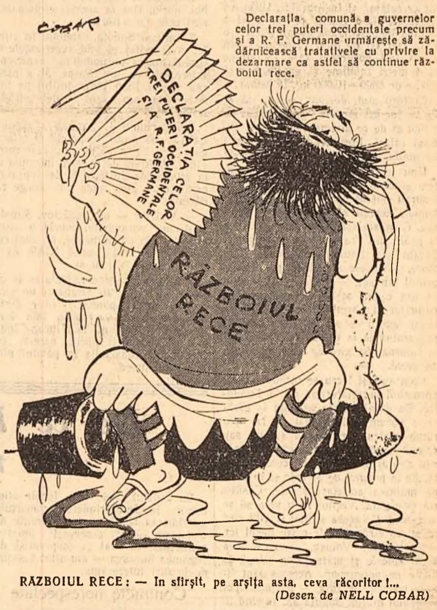
RAZBOIUL RECE: — În sfîrșit, pe arșița asta, ceva răcorilor!... (Desen de NELL COBAR)