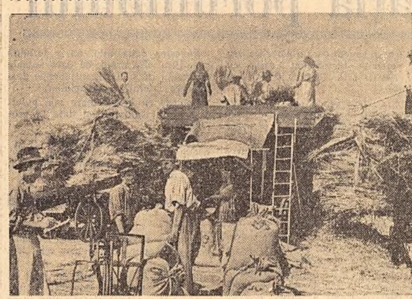
Colectiviiștii din comuna Silistrau, raionul Brăila, au hotărît să trelere zilnic cel puțin 20.000 kg. grâu. Prin-o bună organizare a muncii pe arie, ei depășesc această cantitate. În clișeu: Aspect de la arie.