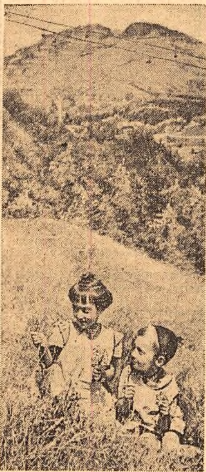
Pe paștea de pe deal, în împărăția soarelui și a florilor, copiii culeg un buchet (Valea Jiului).

Să nu ne preocupăm nici un efort pentru a pregăti elevii condiții tot mai bune de învățămînt în noul an școlar!