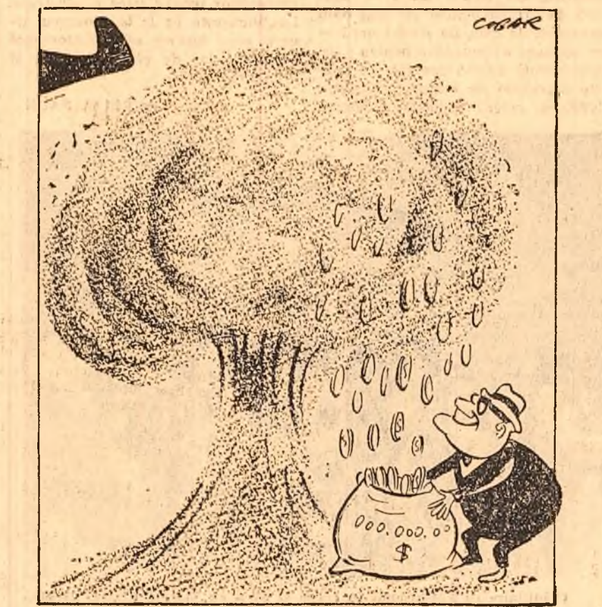
Fabricantul de arme: „...Experiența a reușit! Desen de NELL COBAR