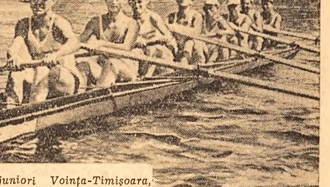
Equipajul de juniori Voința-Timisoara, cîștigător al probei de schif 8+1