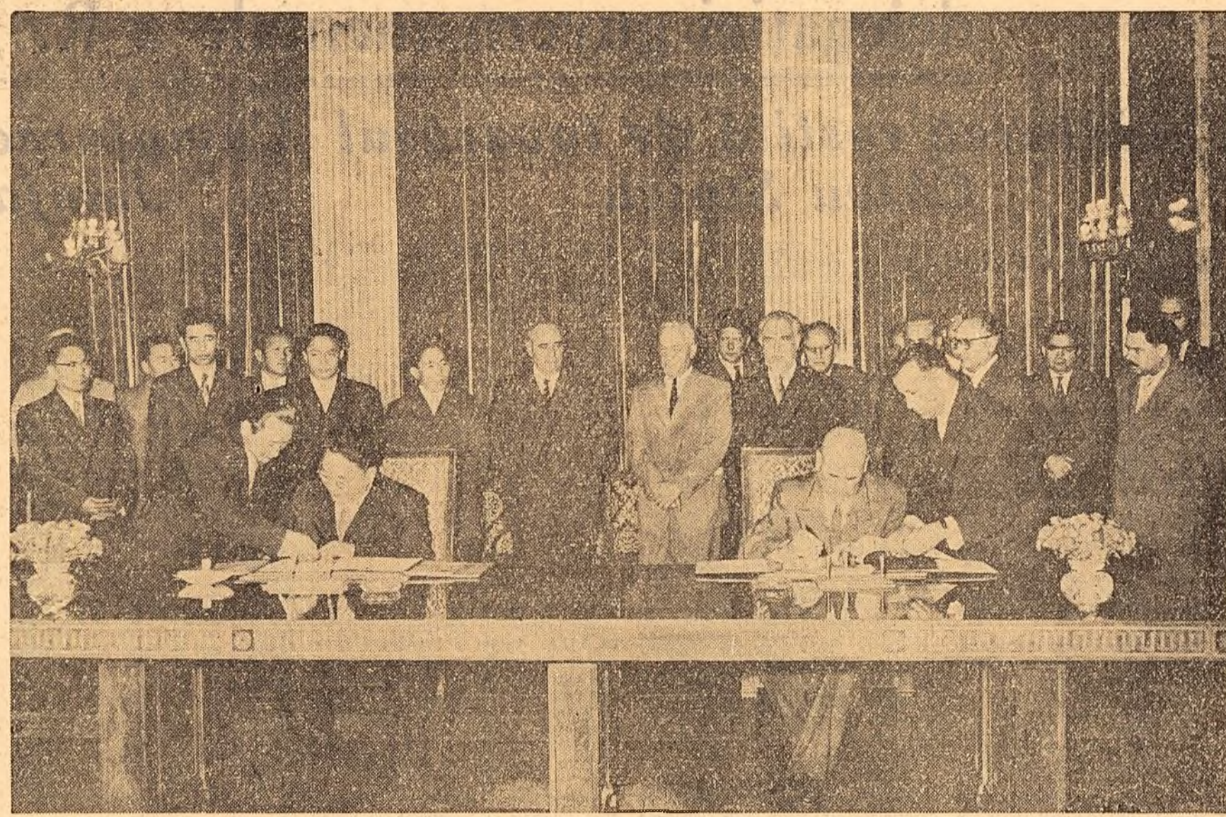
Tovarășii J. Tedenbal și Chivu Stoica semnează declarația comună a delegațiilor guvernamentale ale Republicii Populare Romîne și Republicii Populare Mongole.

Între 4 și 8 septembrie a.c., la invitația guvernului romîn a avut loc vizita de prietenie a delegației guvernamentale ale Republicii Populare Mongole în Republica Populară Romînă.