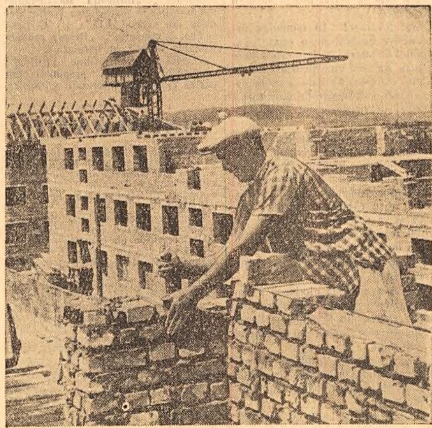
Tirgu-Mures. — În diferite puncte ale orașului se construiesc blocuri muncitorești și clădiri social-culturale. Construcții muncesc de zor. Oamenii muncii așteaptă noi apartamente.