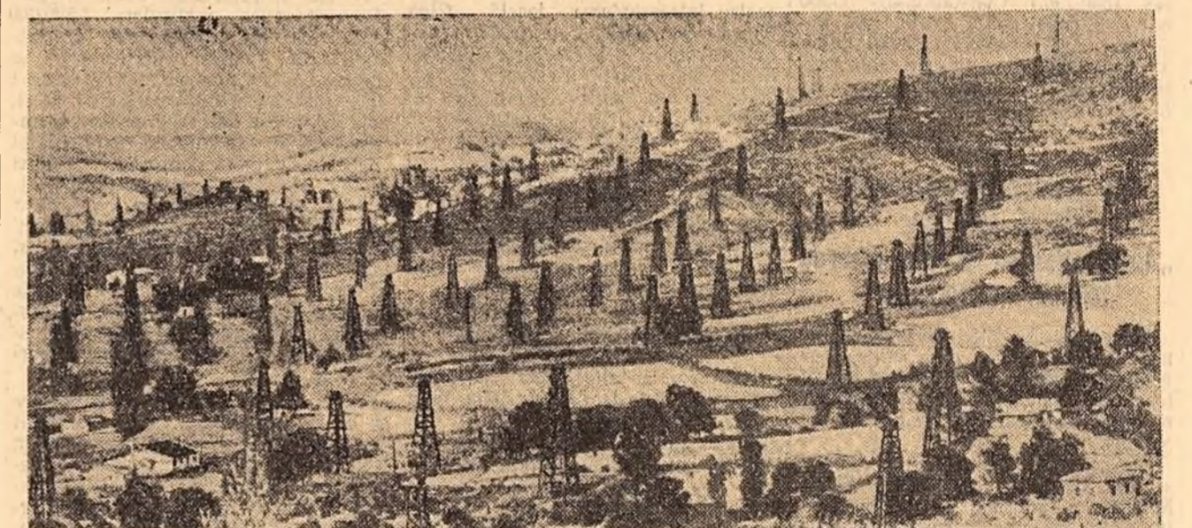
În anii puterii populare, economia națională a Alba- niei — în trecut extrem de înapoată — s-a dezvoltat în mod spectaculos. În locul vechilor și pușinelor ateliere meș- terugărești au apărut mari uzine și întreprinderi mo- derne. Producția industrială globală a crescut de mai bine de 10 ori. În cliseu: O pădure de sonde din regiunea petro- liferă a R. P. Albaniei.

În orașul Eisenberg delegația a plecat la șantiierul barajului de pe- riul Rappode, din munții Harz. În după-amiaza zilei de 11 septem- brie, membrii delegației au plecat în orașul Wernigerode, din regi- una Magdeburg, unde au vizitat Muzeul feudal, care este instalat în castelul Stolberg-Wernigerode.