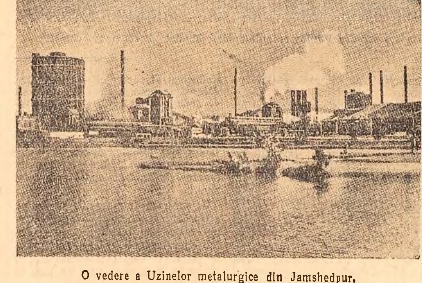
O vedere a Uzinelor metalurgice din Jamshedpur.

uita la mine și făcea. Nici eu n-am mai avut ce zice. Diferența dintre pomii îngrijiiți și cei negrijiiți e ca de la cer la pământ. M-a dus la alt loc, și la alt loc. Tăcea, eu n-am să pot să tac. Trebuie să vorbesc despre succesele obținute de stațiunea experimentală pomologică Voinești. Nu, succesele lor nu pot fi trecute sub tăcere.