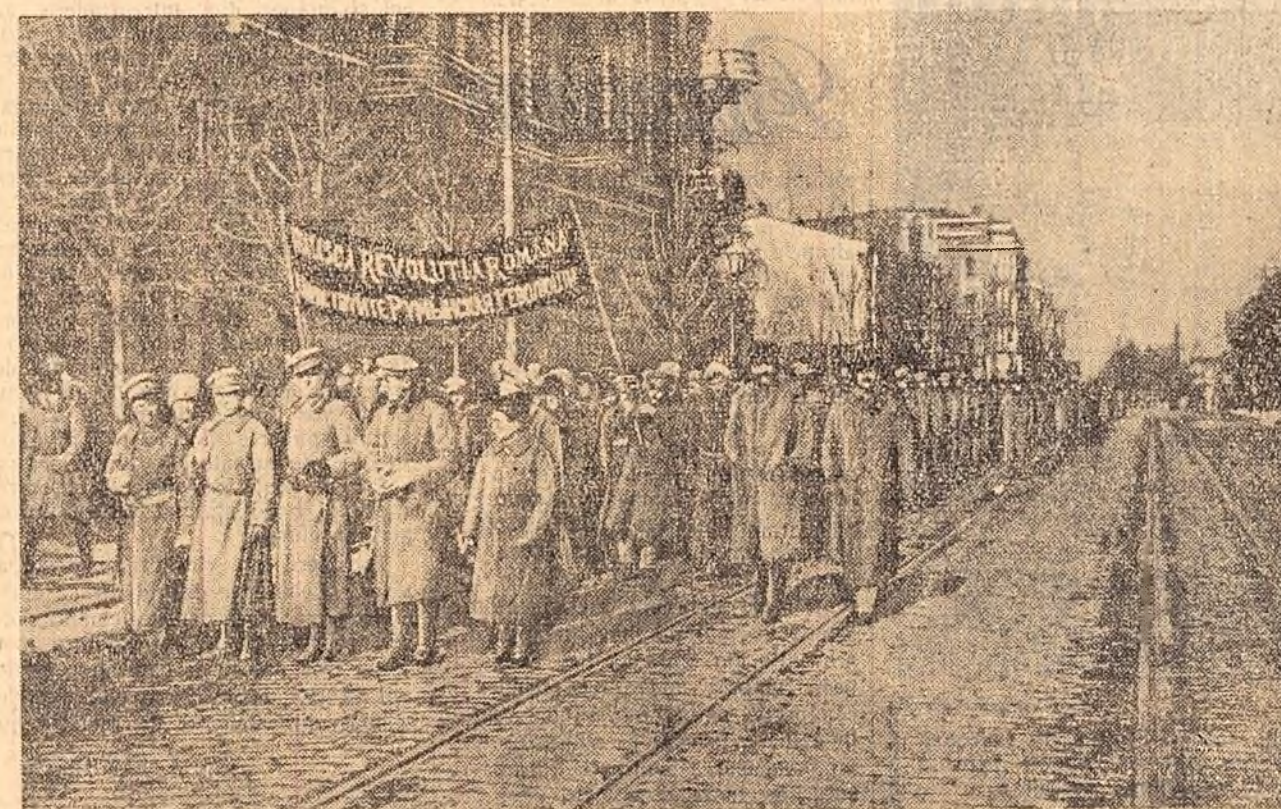
1918. Pe străzile Odesei, batalionul revoluționar român manifestînd cu pancarte: „Trăiască revoluția romîni!”