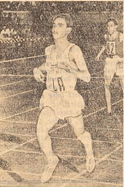
EV. DEPASTAS (Grecia), clasat primul la 800 m. plat