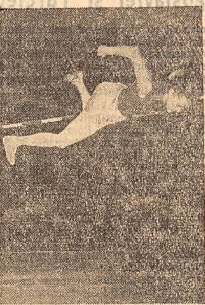
TAISIA CENCIK (Uniunea Sovietică), câștigătoare la săritura în înălțime