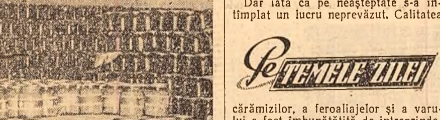
La fabrica de conserve Zagna — Vădeni, raionul Brăila, se lucrează de zor. În cilindrul Borcanelor cu conserve sînt stivute cu grijă în magazia fabricii, de unde vor fi expediate pe piețe.

Uzinele „Mao Tze-dun” din Capitală produc multe rebuturi. Faptul a fost cunoscut nu numai în uzină, dar și la comitetul raional de partid și la Ministerul Industriei Grele. Niemi nu s-a alarmat, în uzină s-au stornicrit încă din ianuarie cîteva cauze obiective care, la început, păreau destul de inofensive. În jurul cuploarelor electrice unui otelari și ingineri, mai cruzi în meserie, aruncau cîte o glumă la adresa celor care le