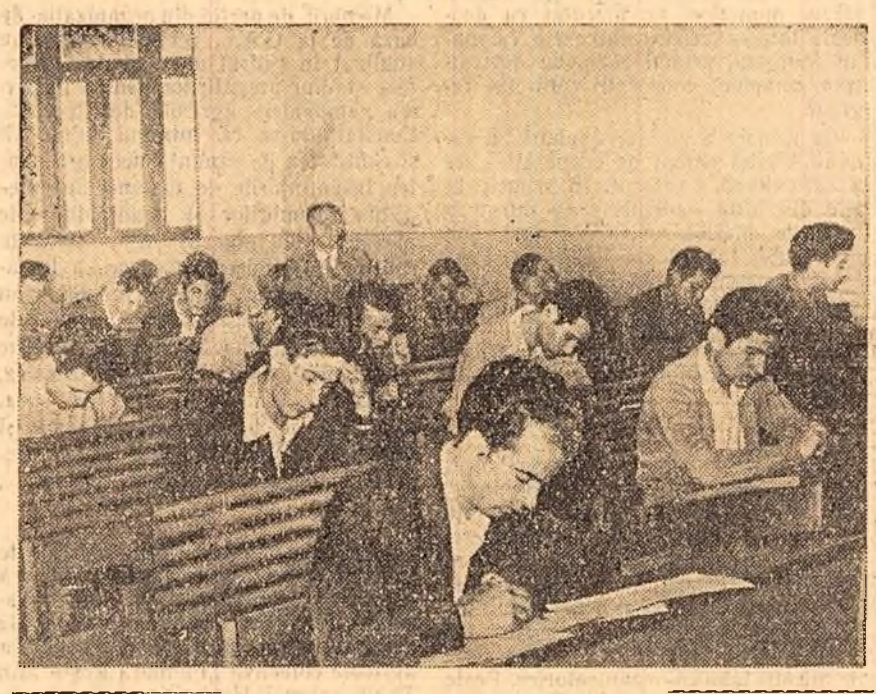
In primele ore ale dimineții de luni, candidații la examenul de admitere de la Institutul de petrol, gaze și geologie din Capitală au dat examen scris la algebra și trigonometrie. Nici chiar prezența fotoreporterului nu-i interesează pe acești tineri. Toată atenția lor e concentrată asupra lucrării de examen.

Răspunderea comitetelor executive ale sfaturilor populare regionale și organizațiilor economice regionale nu înțețeață odată cu achiziționarea sau preluarea produselor de la contractanți. Este deosebit de important ca legumele și cartofii să fie transportați rapid spre orașe și centrele industriale, ca trecerea acestora peste regiunea de munte să se facă într-o perioadă cît mai scurtă, înainte de venirea înghețului, pentru încălzirea și descărcarea lor trebuind să fie asigurate din timp brațele de muncă și utilitățile necesare. Este bine ca pentru produsele legumicole să fie folosite toate mijloacele de transport disponibile. Organele Ministerului Transporturilor și Telecomunicațiilor vor trebui să satisfacă cu precădere cererile de vagoane făcute de O.C.L.-urile A-