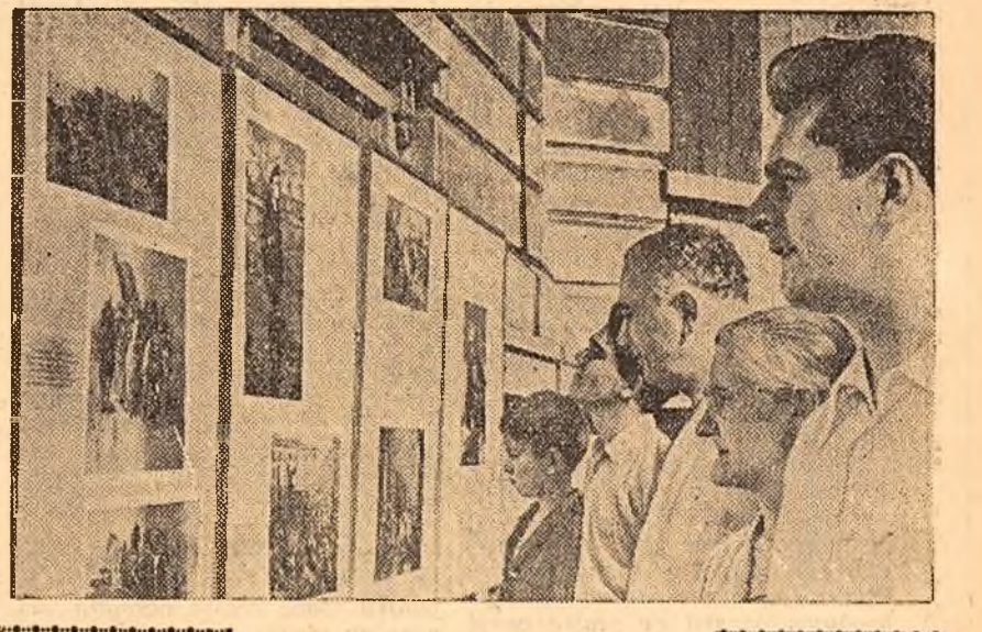
În centrul Capitalei, numeroși cetățeni se opresc în fața panourilor cu fotografii care înfățișează momente din viața și activitatea marelui Lenin.

Nu e multă vreme de cînd în magazine au apărut primele picupuri de fabricație rominescă. Recent, la fabrica „Electrotehnică” din Capitală s-a realizat un nou tip perfecționat de picup. Acesta este prevăzut cu dispozitiv pentru trei viteze de turajie — 33, 45 și 78 trece pe minut — și interupător automat. Reglarea turajiei nu se mai face cu ajutorul discului stroboscopice, ci prin intermediul unui buton. Cu unul picup se pot folosi și discurile microrile. În legătură cu aceasta, se pune însă întrebarea la care numai întreprinderea „Electrotehnică” poate răspunde: cînd vom găsi în magazine în cantități suficiente și discurile microrile?