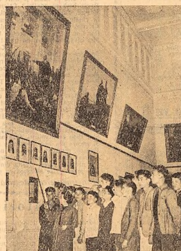
În proeajna aniversării a 40 de ani de la Marea Revoluție Socialistă din Octombrie numeroși cetățeni din Capitală și din țară vizitează în aceste zile sălile muzeului Lenin-Stalin. În clisou: Elevii anului III al Centrului școlar agricol Giurgiu primesc explicațiile ghidului.