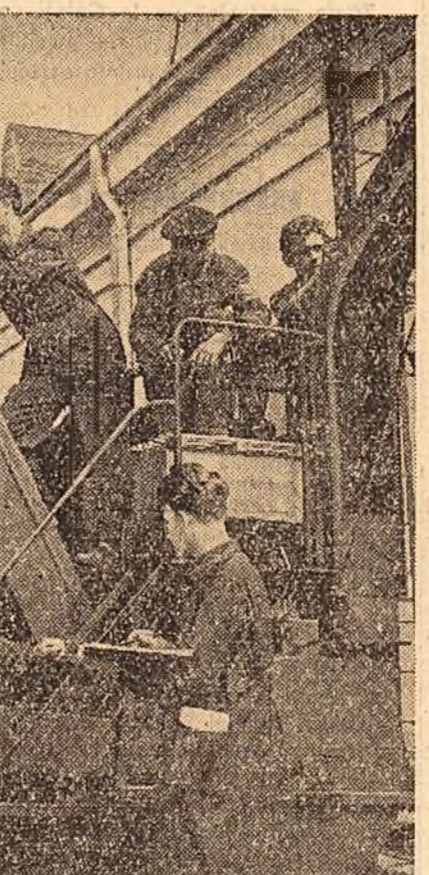
Muncitorii, inginerii și tehnicienii uzinelor „Semănătoarea” din Capitală obțin nu succese în întrecerea socialistă. Ei s-au angajat să reducă — pînă la 7 Noiembrie — prețul de cost cu 2%, angajament care a fost realizat de pe acum.