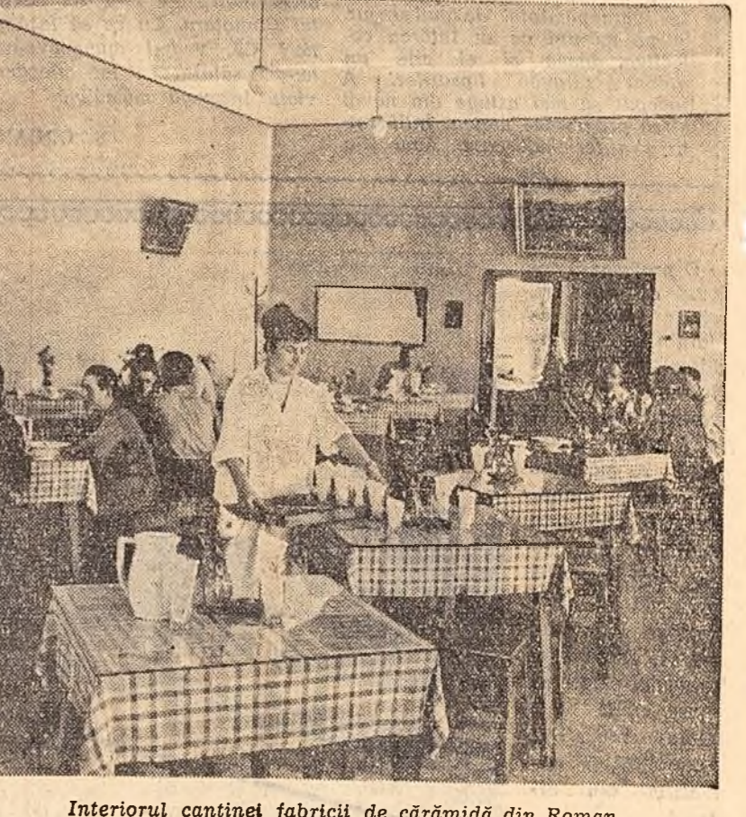
Interiorul cantinei fabricii de cărămidă din Roman.

Viitoarea secție — vama medievală — se adaugă celor peste 20 de secții care readau istoria castelului Bran, unul din cele mai vizitate muzee din țară.