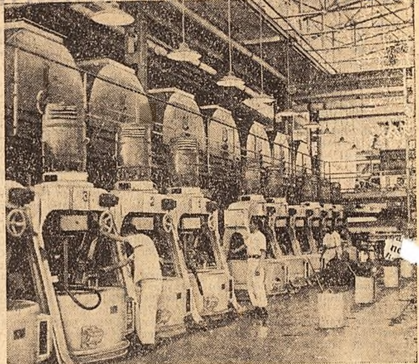
Rafinăria de zahăr „Sinciuokuo” („China Nouă”) din provincia Kirin poate prelucra zilnic peste 100.000 tone de sfeclă. După eliberare, în China populară au fost reutilizate sau construite din temelii 12 rafinării de zahăr cu aceeași capacitate.