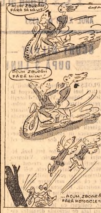
Desen de NELL COBAR

TEAMĂ La una din seratele date de compozitorul Rossini, o doamnă rugată să cînte, făcea nazuri.