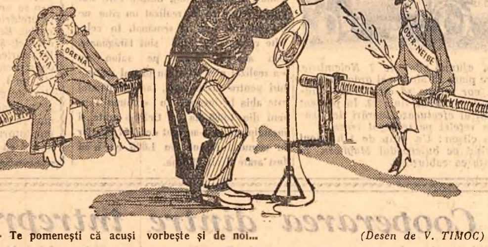
— Te pomenești că acuși vorbești și de noi... (Desen de V. TIMOC)

Un bancher era pe patul de moarte. Cu toate acestea, nu se gîndea decât la acțiuni, dividende, burse.