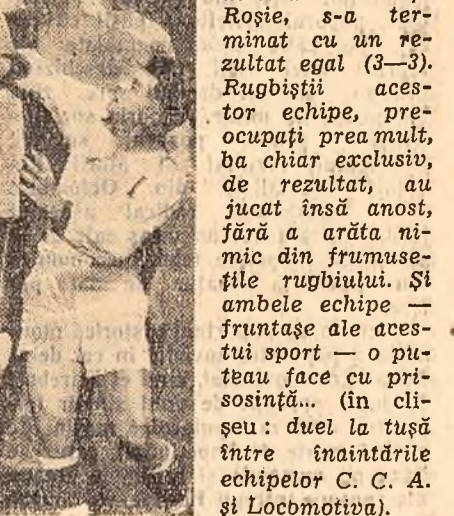
Rugbiștii acestor echipe, pre-ocupai prea mult, ba chiar exclusiv, de rezultat, au jucat însă anost, fără a arăta nimic din frumusețile rugbiului. Și ambele echipe — frunzate ale acestui sport — o puteau face cu prisosință... (în clișeu: duel la tușă între mîntăritorii echipelor C. C. A. și Locomotiva).

Derbiul etapei, C.C.A. — Locomotiva Grivița Roșie, s-a terminat cu un rezultat egal (3-3).