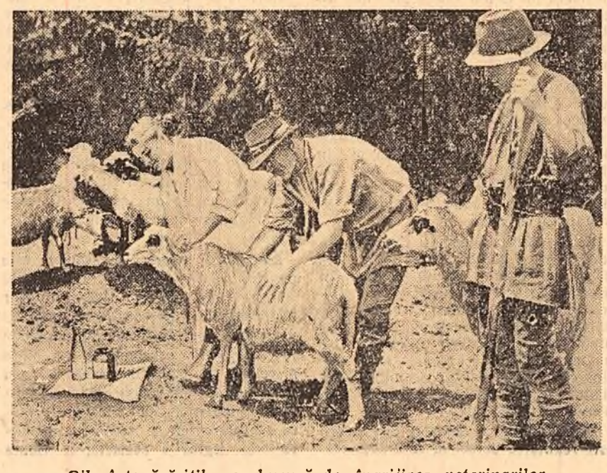
Oile întovărășitorilor se bucură de îngrijirea veterinarilor