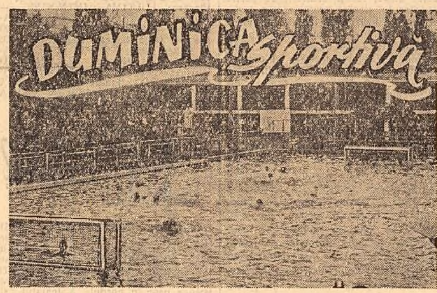
La bazinul „Dante Gherman” din Capitală a avut loc prima ediție a „Cupei Bucureștilui” la polo pe apă. În clișeu: aspect din timpul unui meci. (Citiți rubrica de sport în pag. a 2-a).

Acest lucru a stimulat intrarea unui număr mare de țărani muncitori în gospodăriile colective și în întovărășirile agricole. Numai în raionul Satu Mare au fost complet cooperativizate 15 sa'e. Printre acestea se numără satele Hrip, Tătărești și Tinoc.